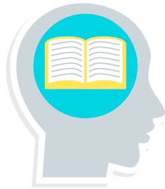
Fig.1. Conocimiento, motor del desarrollo [3].