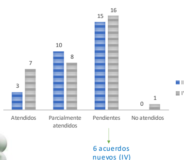
COMPARATIVO TRIMESTRE ANTERIOR