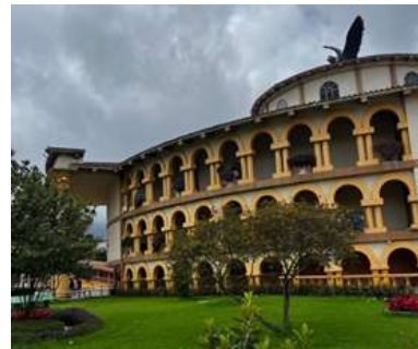
Parque Jaime Duque