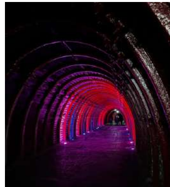
Catedral de sal

Durante la gira académica a Bogotá, Colombia, los estudiantes y profesores de la carrera de Ingeniería en Producción Industrial también tuvieron la oportunidad de visitar algunos de los lugares más emblemáticos de la región. Entre estos, destacan el majestuoso Parque Jaime Duque, el Cerro de Monserrate y la impresionante Catedral de Sal en Zipaquirá donde se conserva Nuestra Señora Virgen de los Ángeles, Patrona de Costa Rica. Estas visitas no solo brindaron una valiosa experiencia cultural, sino que también permitieron a los participantes conocer de cerca la riqueza histórica y natural de Colombia.