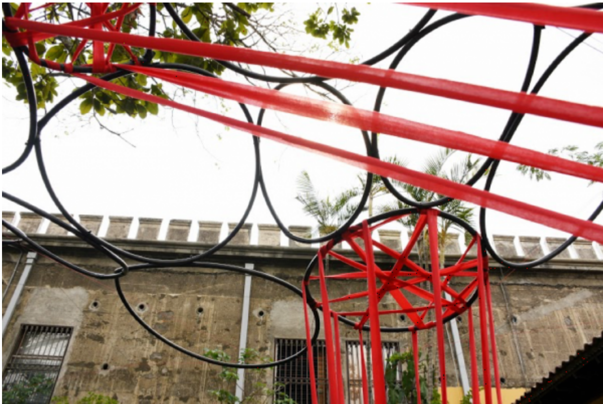
“Una interpretación geométrica y abstracta, en la cual mediante 5 elementos verticales, se plasma la esencia de las 5 torres iniciales del Cuartel Bella Vista.” Grupo 4