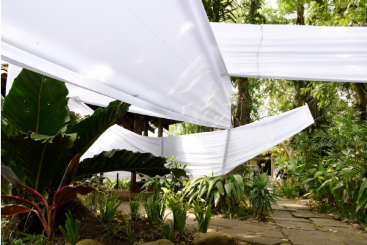
“Una parte de nuestra identidad, una parte de nuestra historia” Grupo 8.