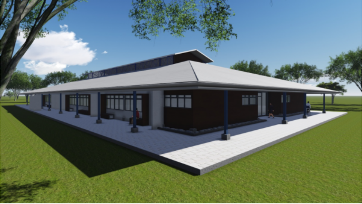
Edificio de Docencia.

Docencia (1984m2): 12 aulas, dos laboratorios de computación, servicios sanitarios. Tendrá una capacidad para 350 estudiantes.