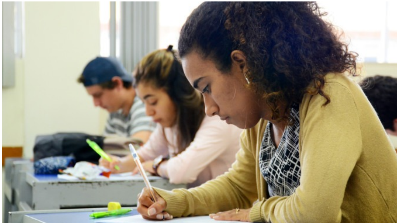
Estudiantes del TEC en clases. Imagen con fines ilustrativos

Fondo Solidario de Desarrollo Estudiantil (FSDE)