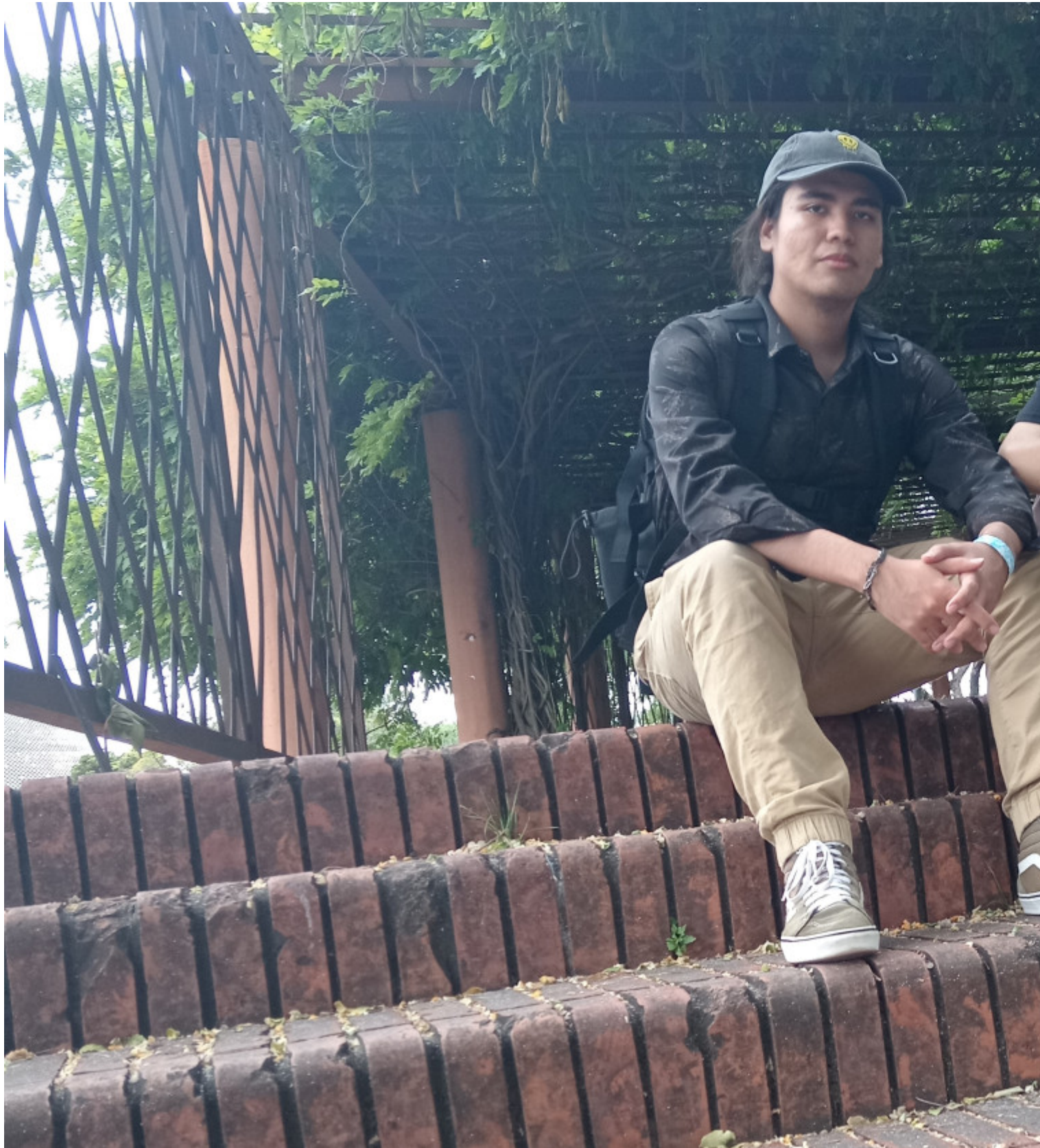
Porras y Ceciliano dijeron que haber colaborado en el proyecto fue una experiencia