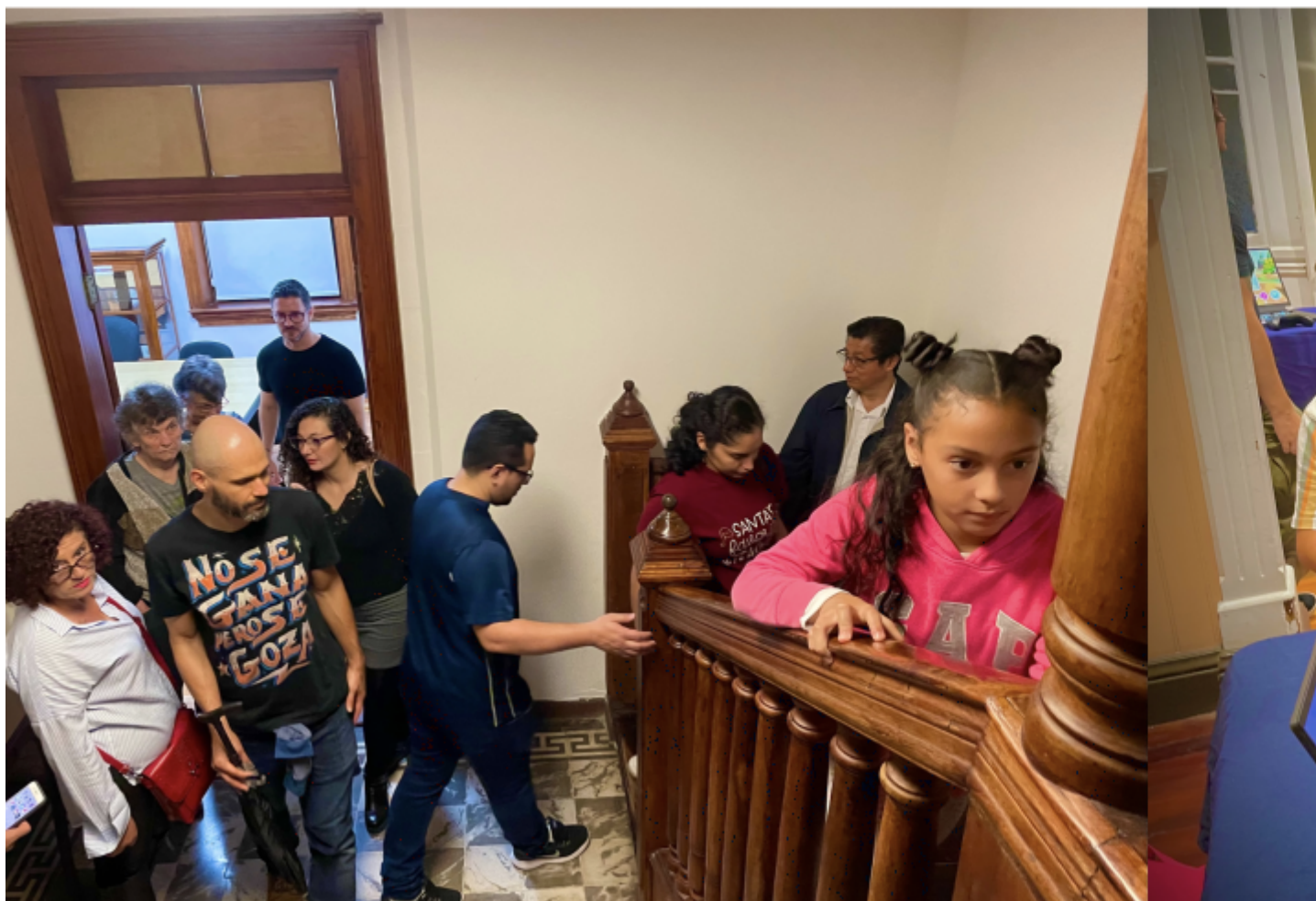
A la izquierda, la visita guiada y a la derecha la exposición de videojuegos.