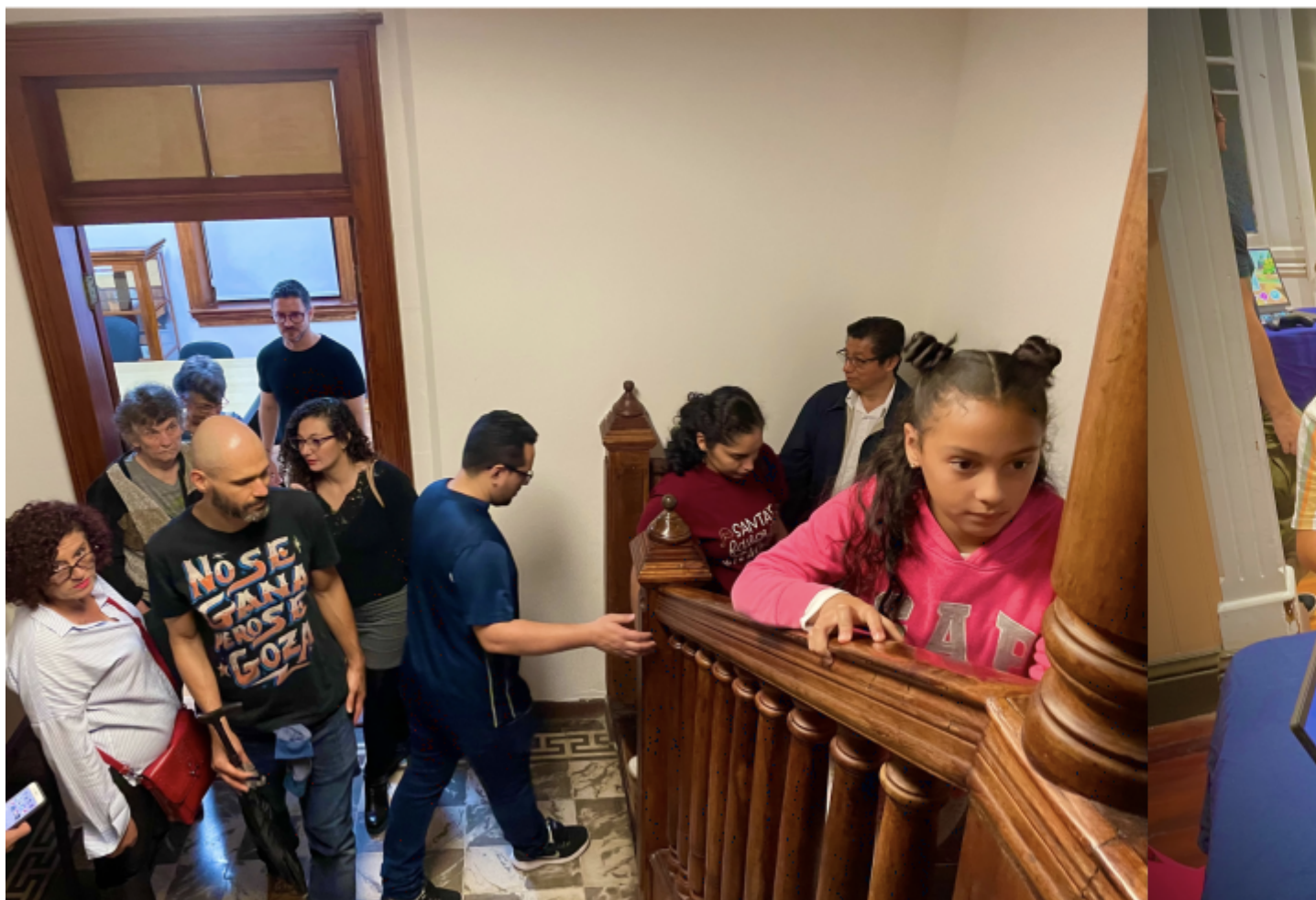
A la izquierda, la visita guiada y a la derecha la exposición de videojuegos.