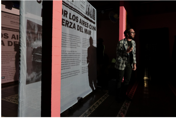
Estreno de “ Unos Cuentos Peregrinos ” en Casa Cultural Amón.

Esta ya inusual experiencia de recopilación de historias fue la que tomó como reto Teatro Agosto en este 2023 . El resultado es una propuesta escénica que combina la pasión artística con la resolución de problemas propia de la ingeniería; mezcla de tecnología y actuación en el escenario .