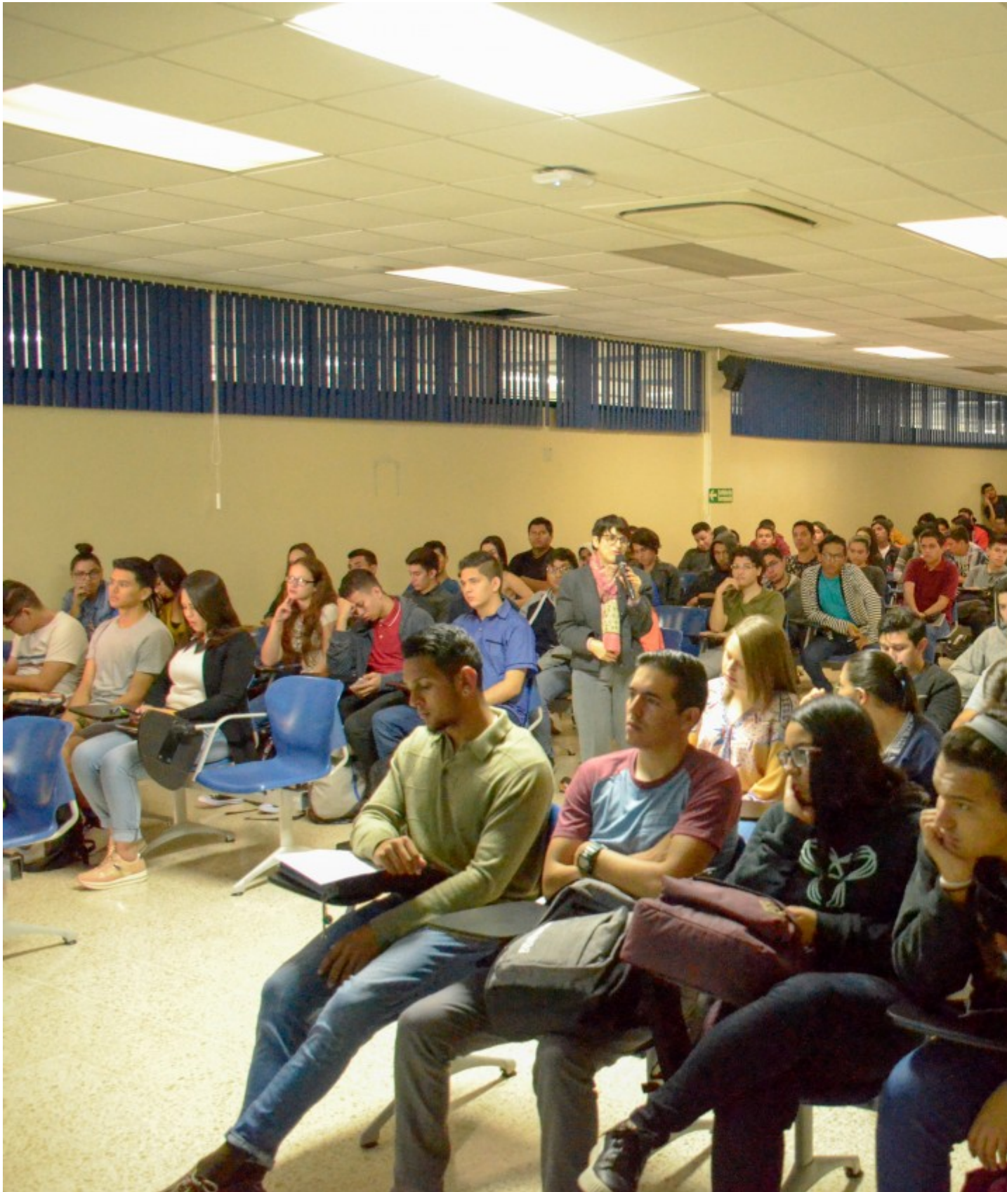
Cada año, los jóvenes beneficiados reciben una charla de inducción, cursos de