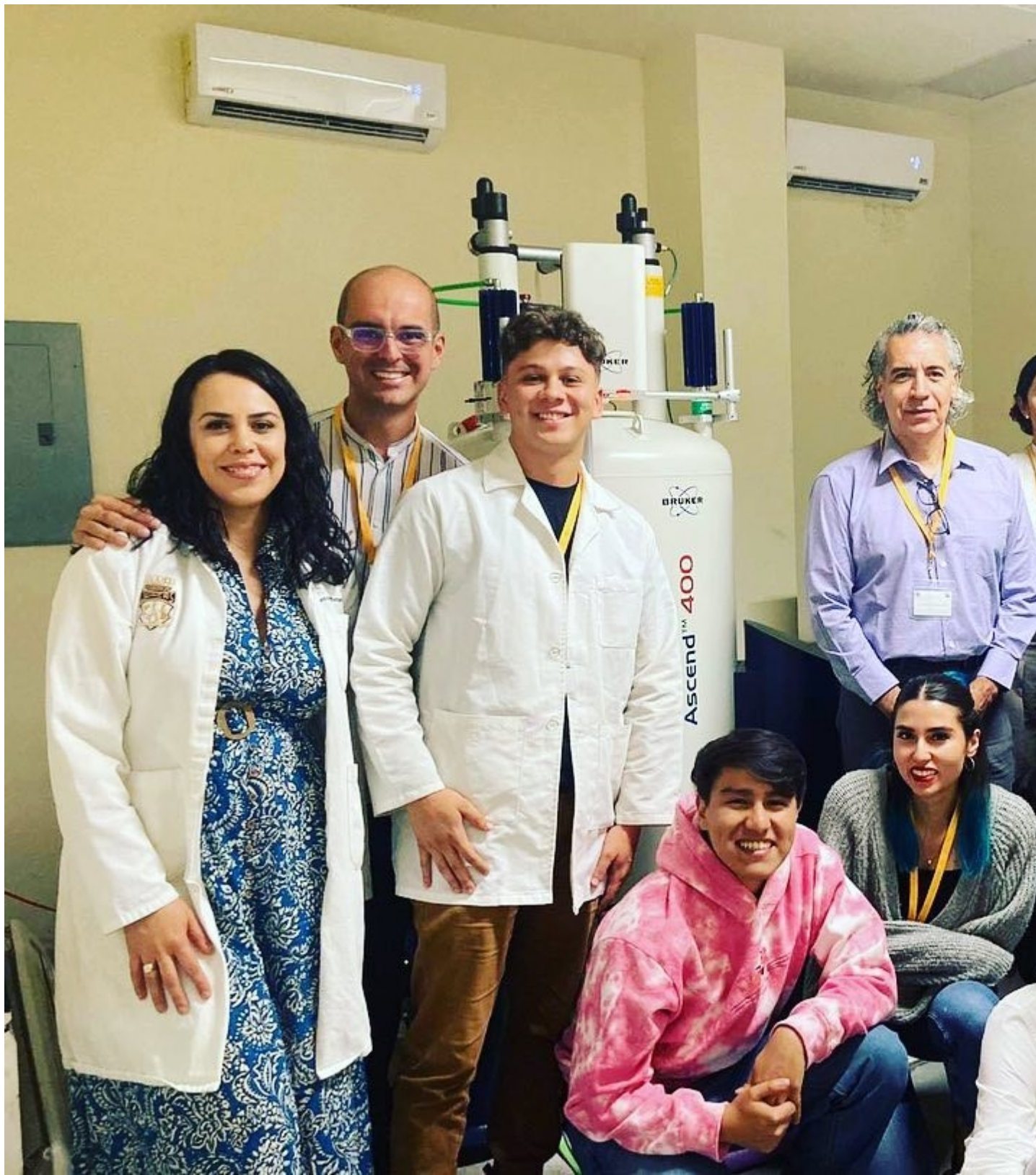
Equipo que participó en el VI Escuela de Verano en Resonancia Magnética Nuclear.