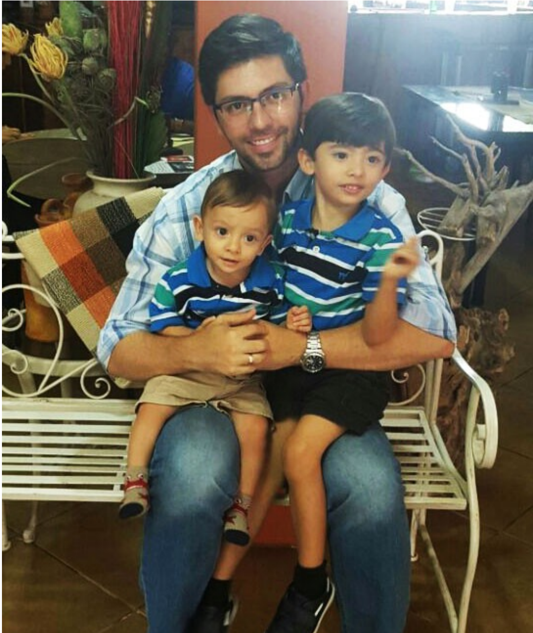
El Dr. en Ingeniería junto a sus dos hijos.