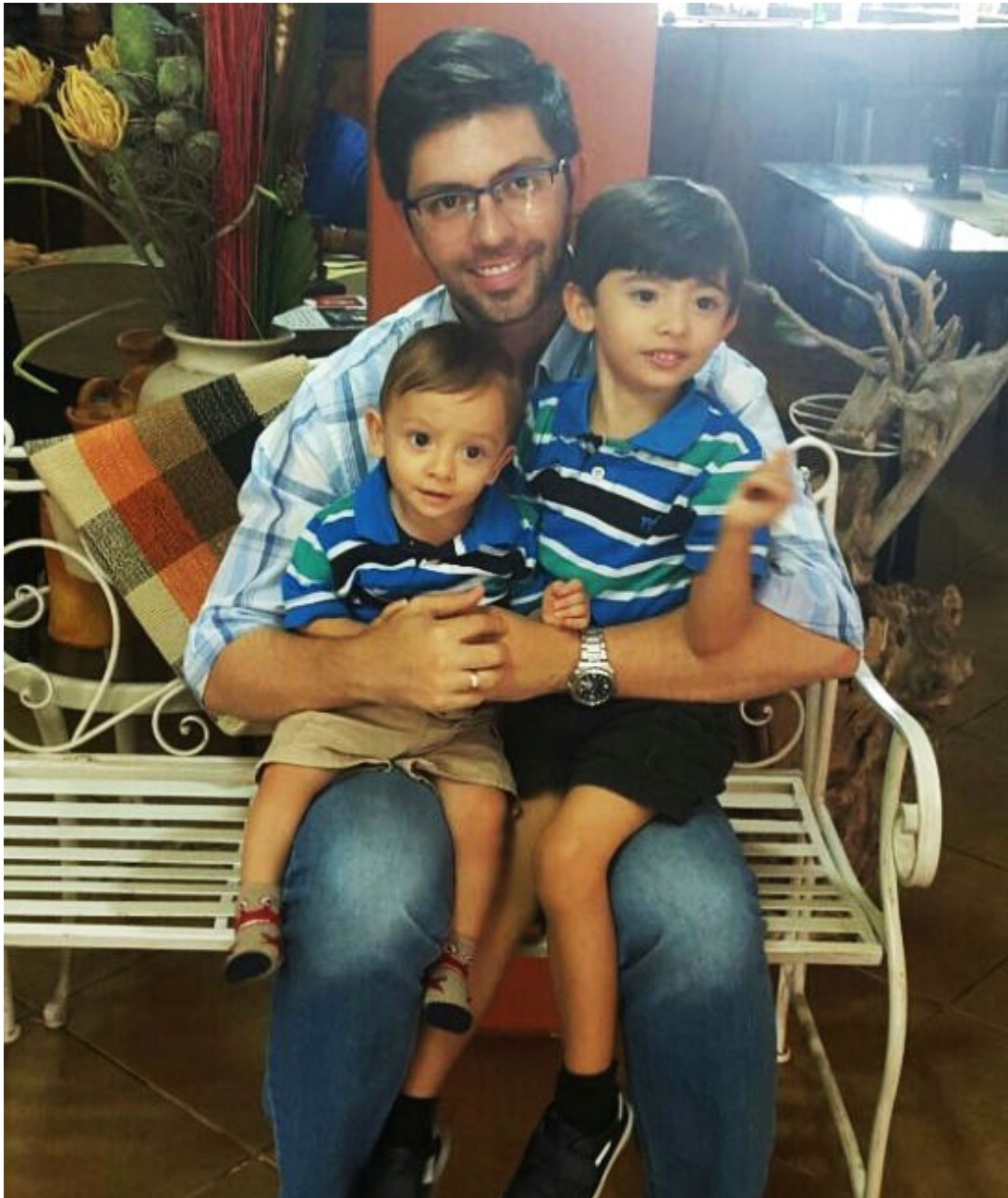
El Dr. en Ingeniería junto a sus dos hijos.