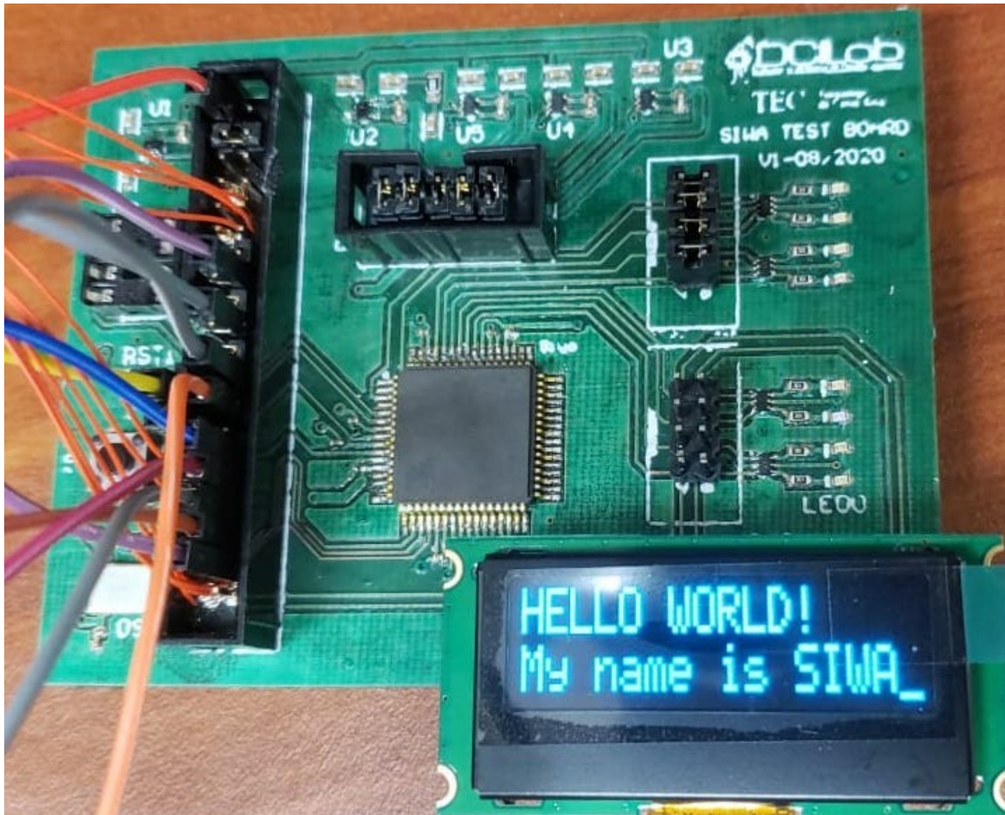
Muestra del primer microcontrolador creado en Costa Rica.

Este es el primer microcontrolador integrado de 32 bits desarrollado completamente en Costa Rica , fabricado sobre una tecnología comercial CMOS de 180 nanómetros.