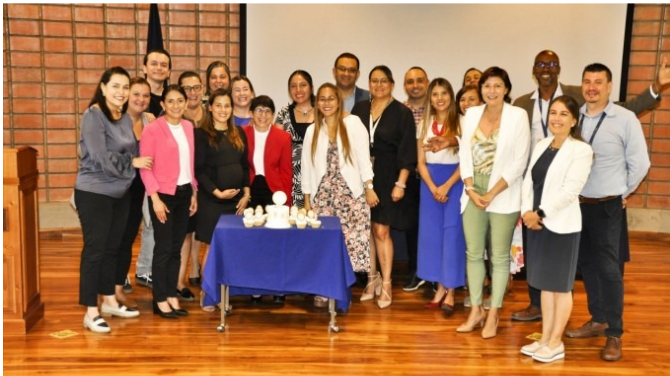
Funcionarios y funcionarias del DOP celebraron el 50 aniversario del Departamento.

Departamento de Orientación y Psicología