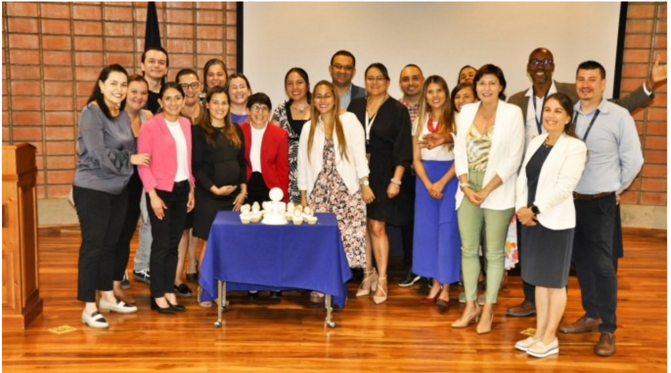
Funcionarios y funcionarias del DOP celebraron el 50 aniversario del Departamento.

Departamento de Orientación y Psicología