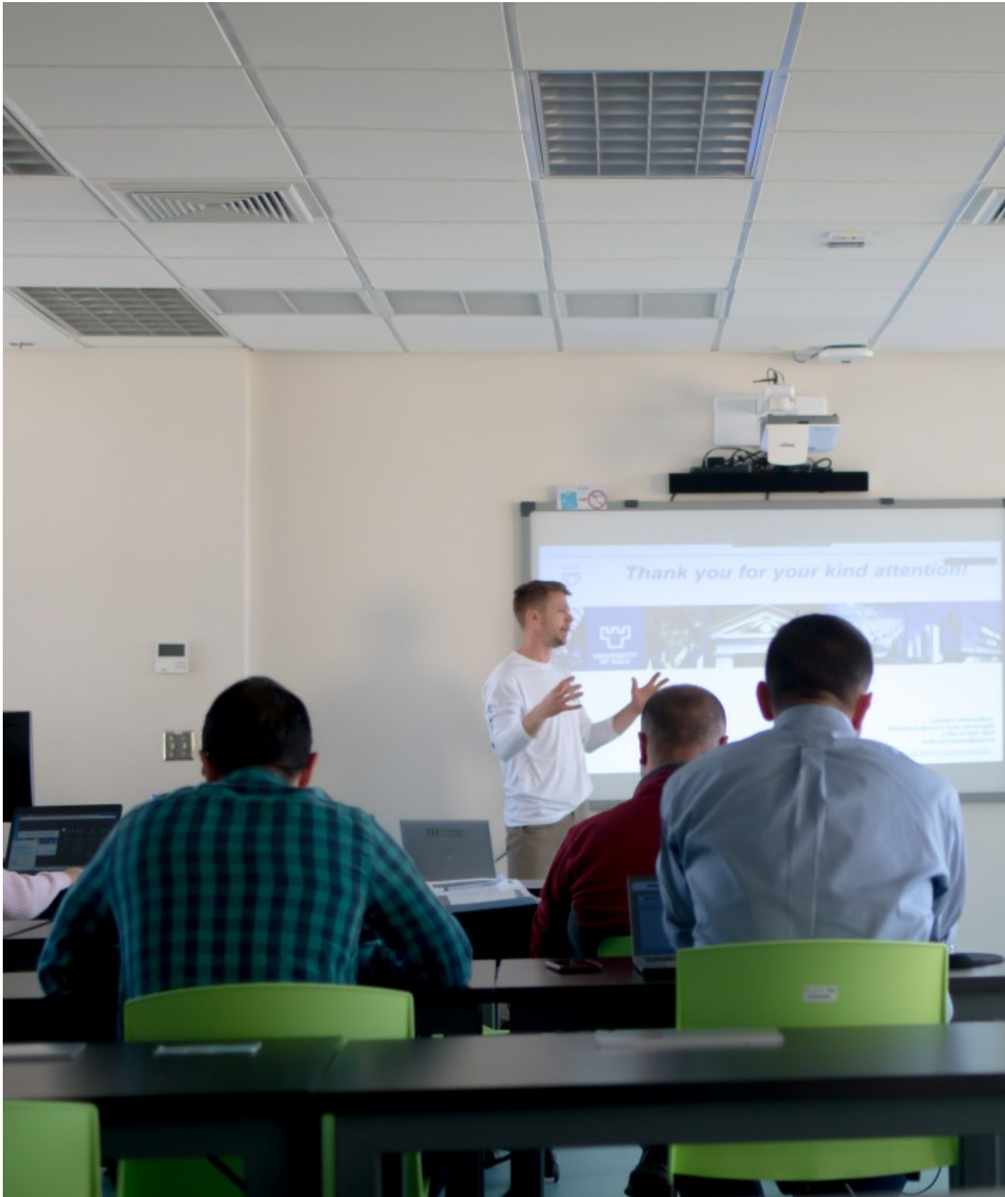
Durante la estancia de los europeos en el país tuvo lugar un simposio sobre