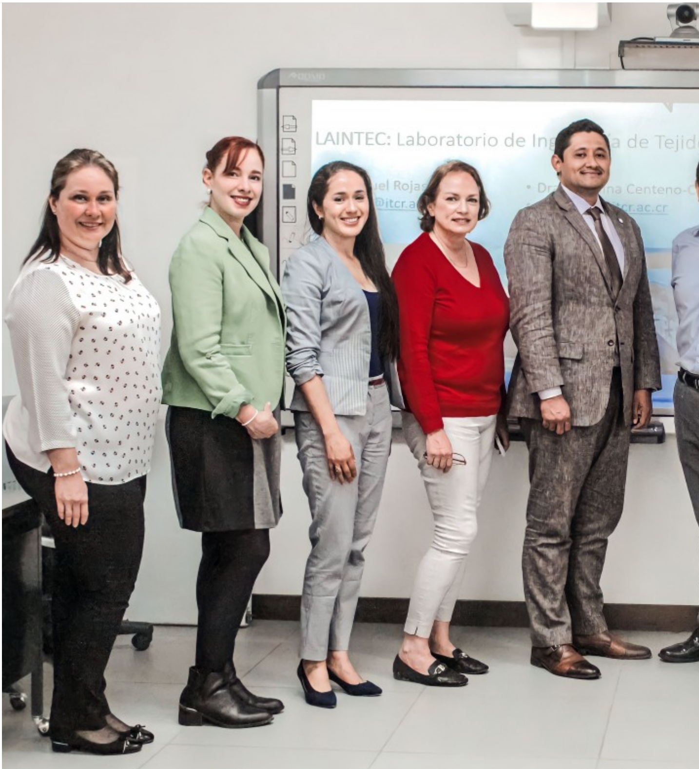
El Ministro a.i. y sus asesores estuvieron en las instalaciones del CIB y fueron recibidos por autoridades y profesionales del TEC.