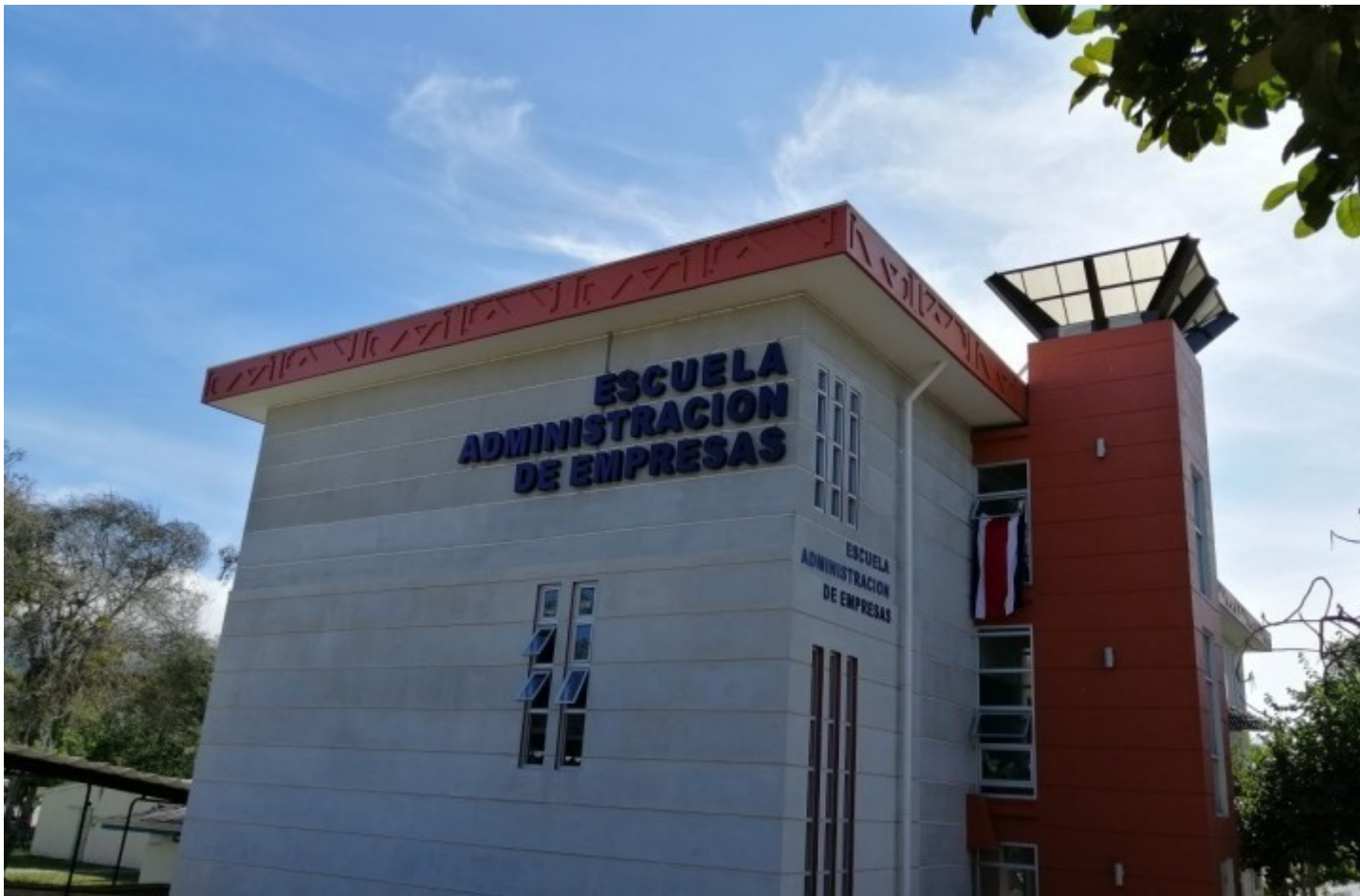
Escuela de Administración de Empresas del Campus Tecnológico Central Cartago.