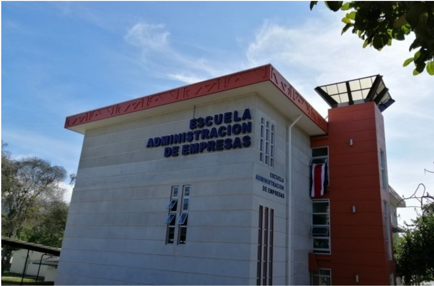
Escuela de Administración de Empresas del Campus Tecnológico Central Cartago.