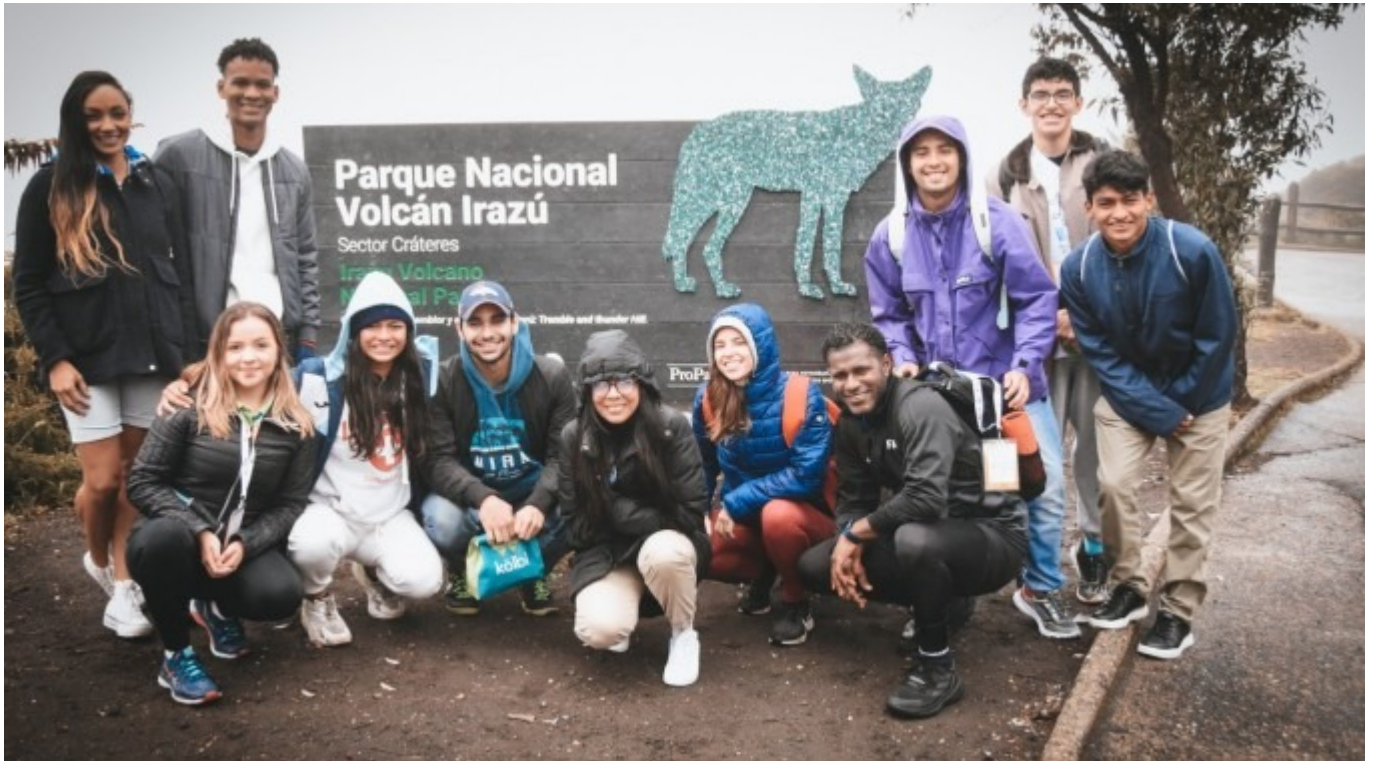
El volcán Irazú es uno de los principales puntos turísticos de la provincia de Cartago. Imagen con fines ilustrativos.

I Encuentro del anillo turístico de la provincia de Cartago y Los Santos