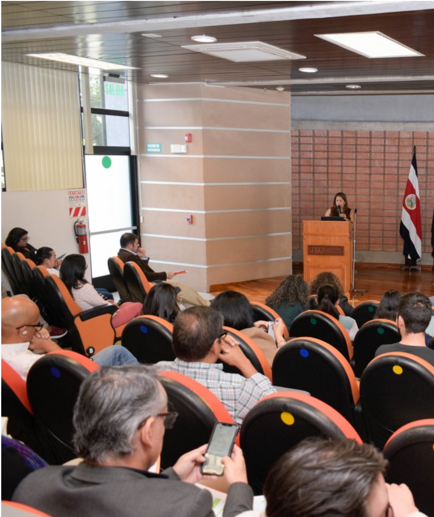
El encuentro del Anillo Turístico tuvo lugar en el Campus Cartago del TEC y