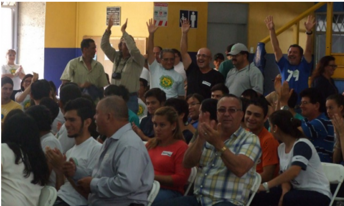
De pie y saludando, exestudiantes y funcionarios de la Sede San Carlos del TEC.