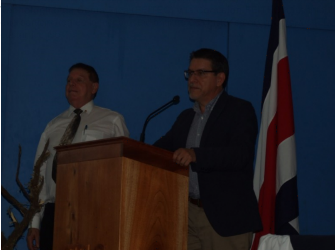
El doctor Julio Calvo,

actual rector del TEC participó en la actividad de cierre del Festival Armando Vásquez.