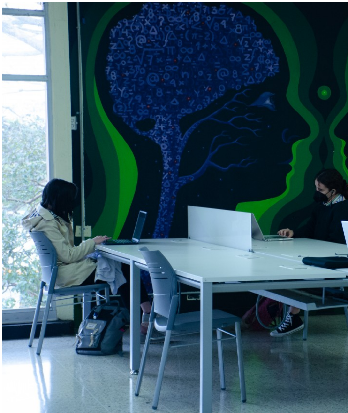
El servidor tiene una participación de 500 estudiantes de Ingeniería en Computación