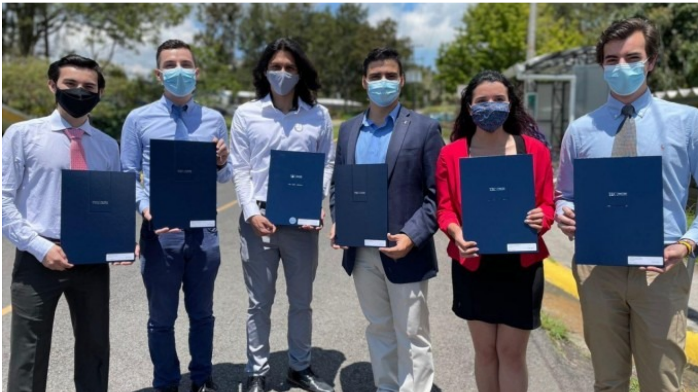
Graduados de la carrera de Ingeniería Mecatrónica.