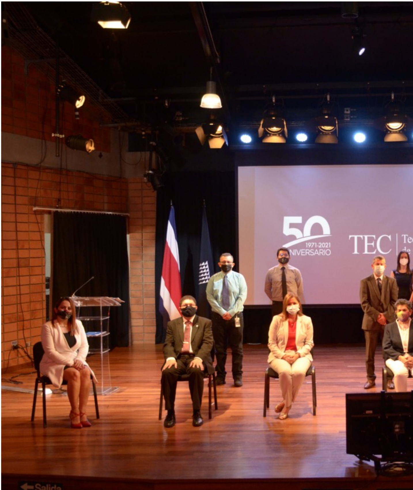
Personas electas y suplentes (sentados) en compañía de miembros del Tribunal y el