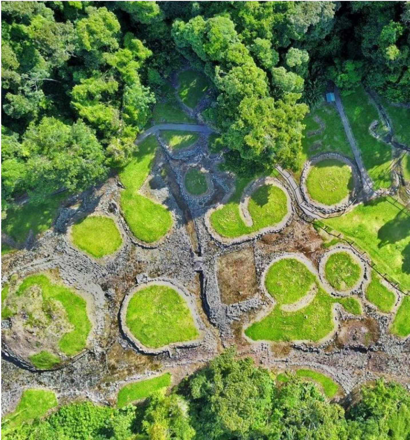
Monumento Nacional Guayabo uno de los lugares que formaría parte del anillo turístico.