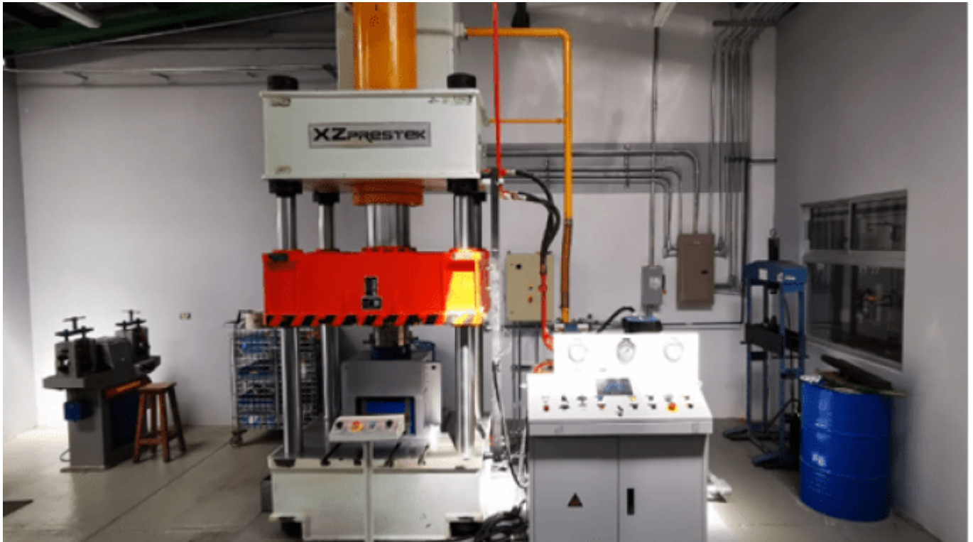
Máquina de torsión de alta presión (HPT) en el Laboratorio de Transformación de Materiales del Centro de Investigación y Extensión en Materiales (Ciemtec) de la Escuela de Ciencia e Ingeniería de los Materiales.

Centro de Investigación y Extensión en Materiales