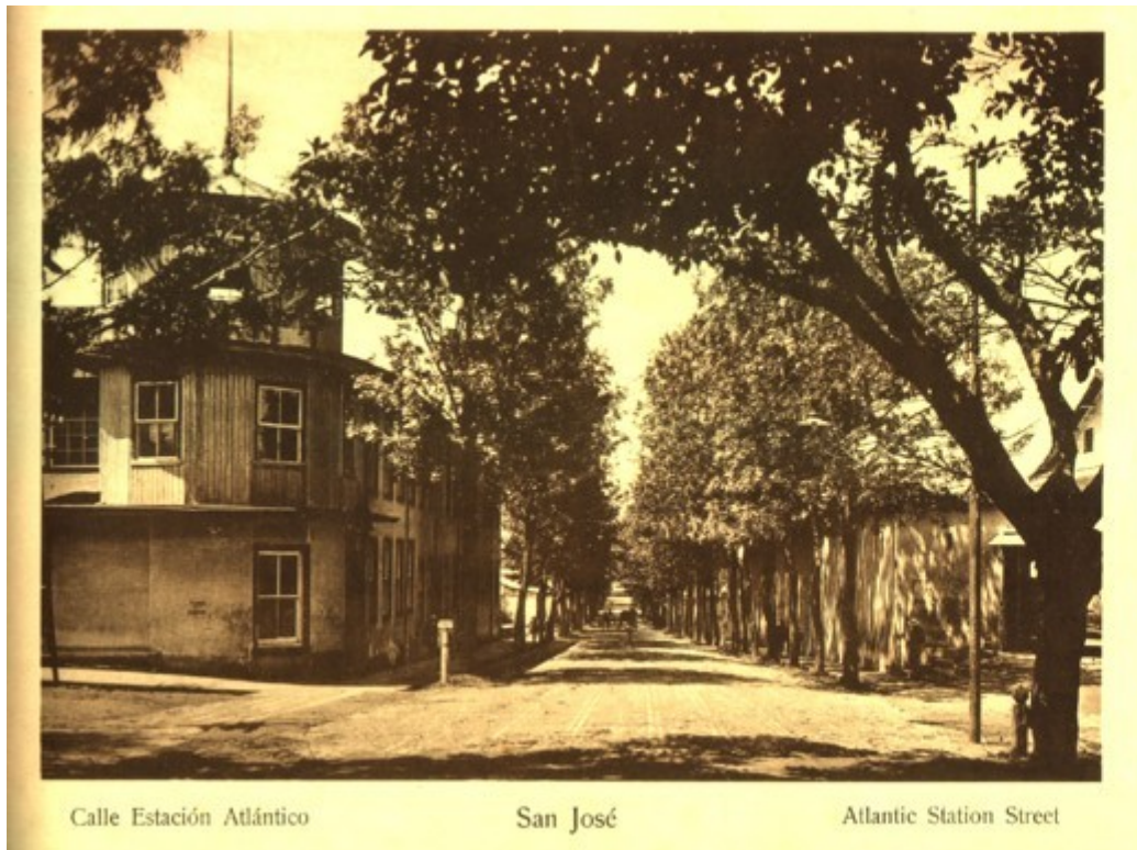
Calle Estación Atlántico