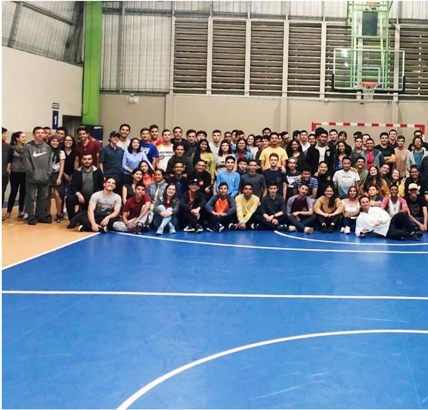
Generación PAR 2020.

Source URL (modified on 01/20/2023 - 04:00): https://www.tec.ac.cr/hoyeneltec/node/3760