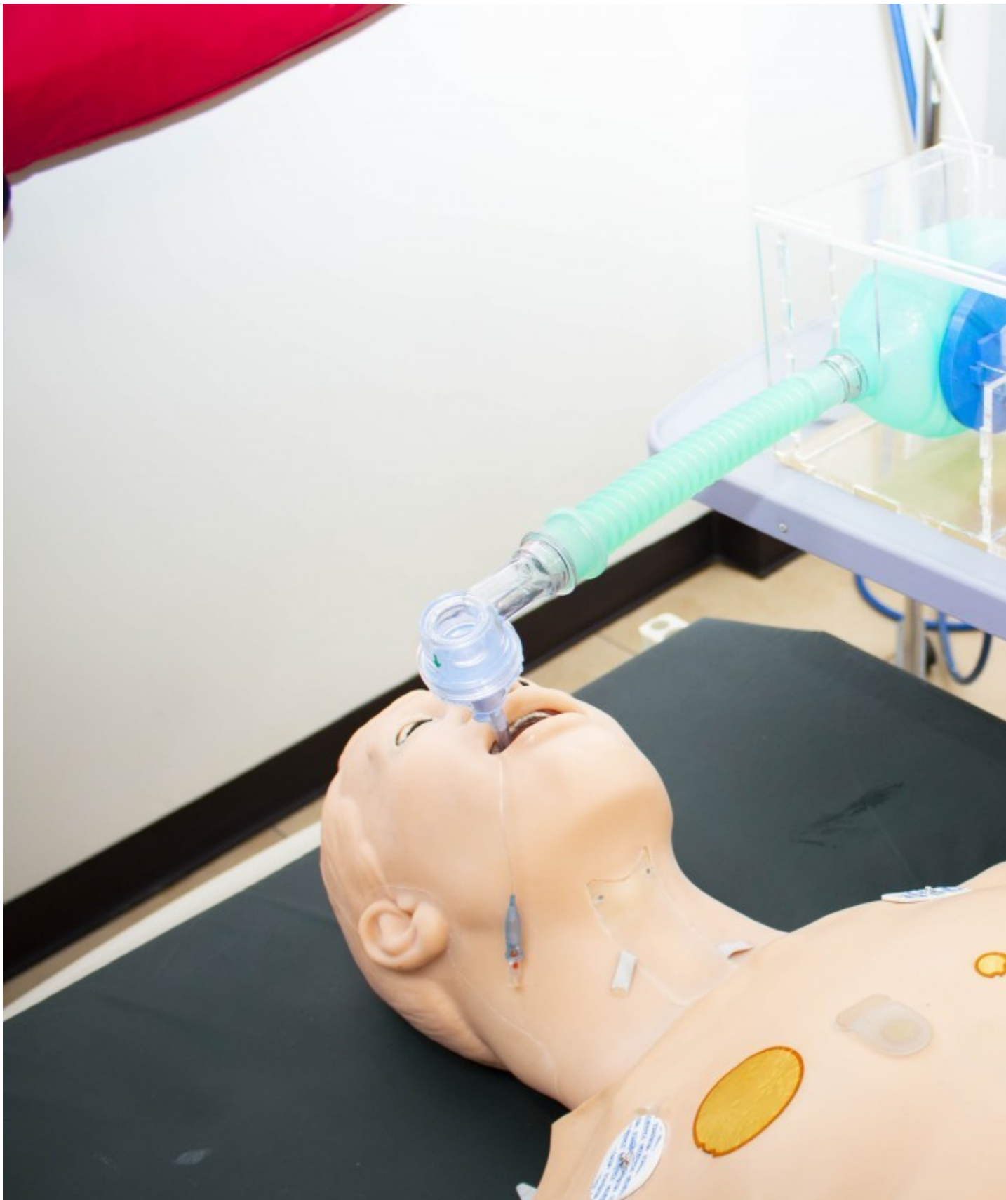
La fotografía muestra uno de los respiradores del TEC, cuyo principio de