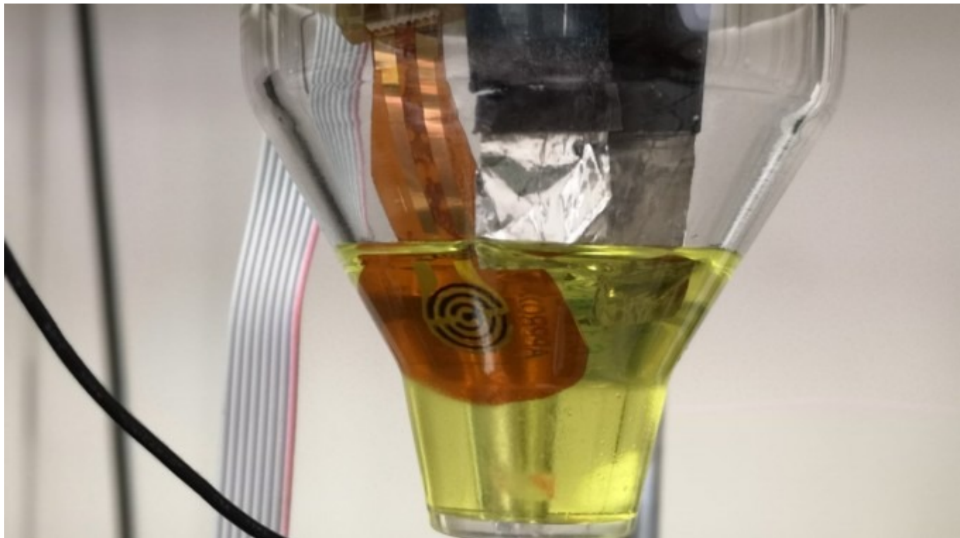
Electrodo flexible de oro modificado para la determinación de plaguicidas en agua.