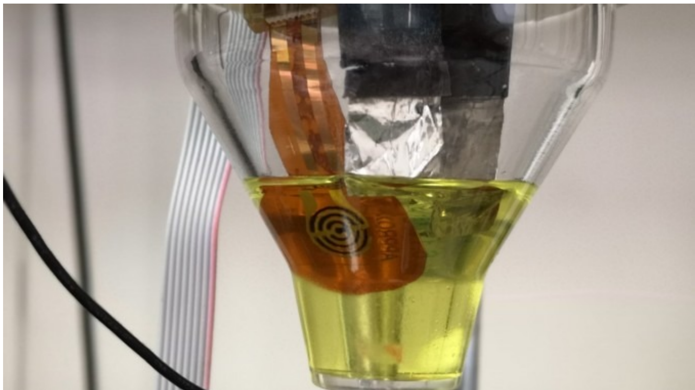
Electrodo flexible de oro modificado para la determinación de plaguicidas en agua.