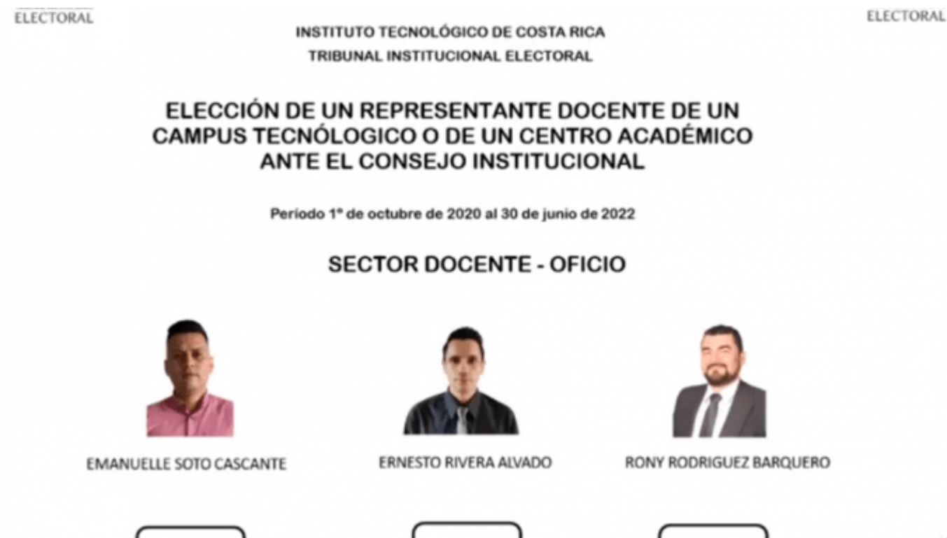
Imagen de la papeleta para el sector Docente-Oficio en las próximas elecciones del Consejo Institucional, según el acomodo que se sorteó durante la entrega de las procedencias. Captura de pantalla de transmisión en vivo de la sesión.

Tecnológico celebró, por primera vez, un evento protocolario de manera telepresencial