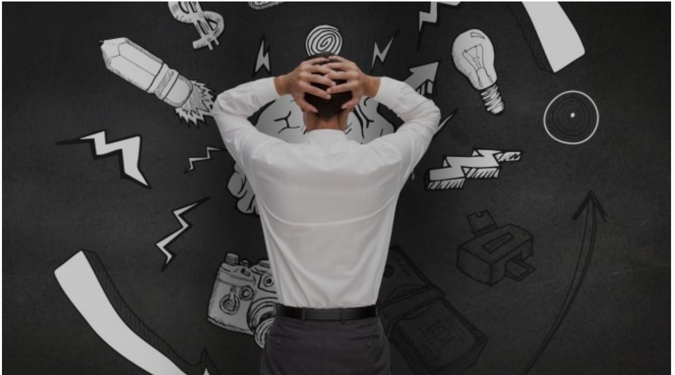
Imagen con fines ilustrativas.

Departamento de Orientación y Psicología