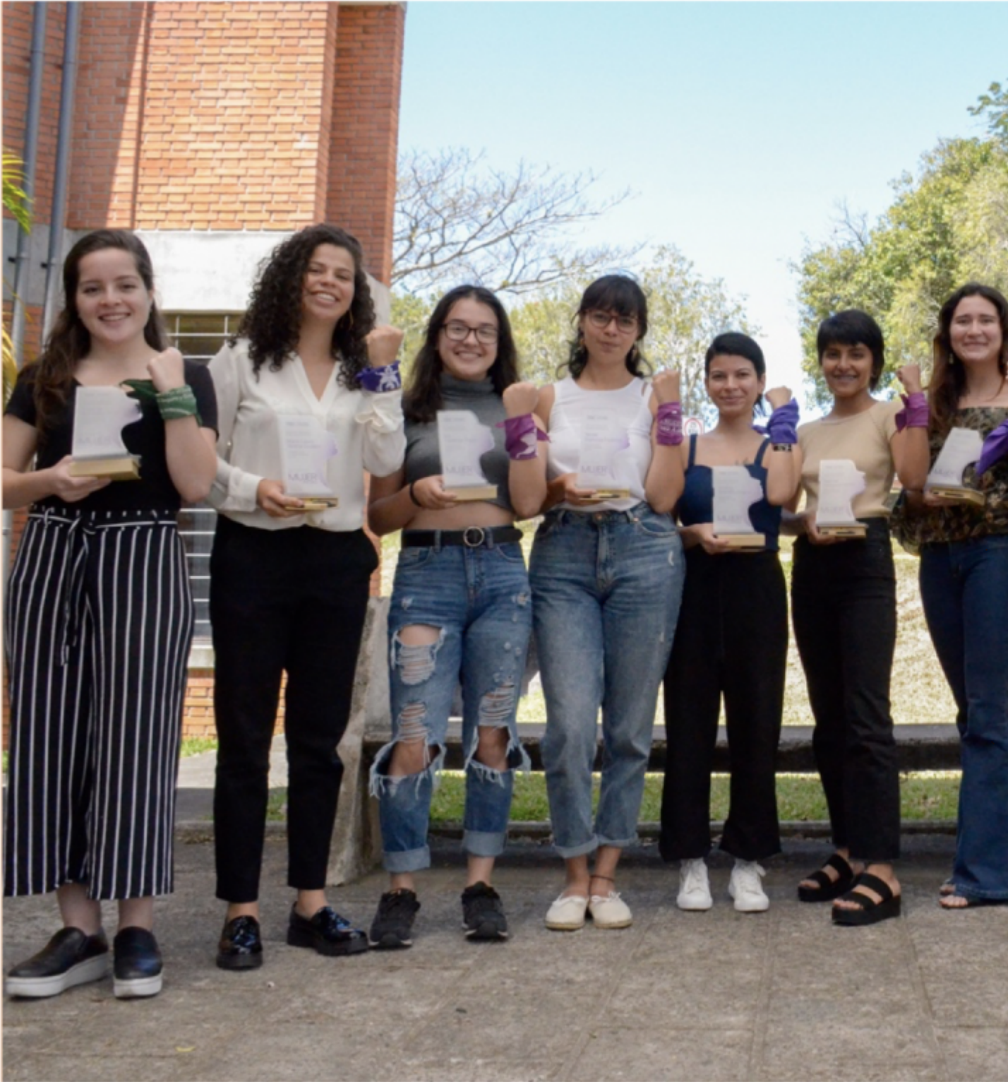
El reconocimiento fue dado a las 12 integrantes de la Comisión Feminista.