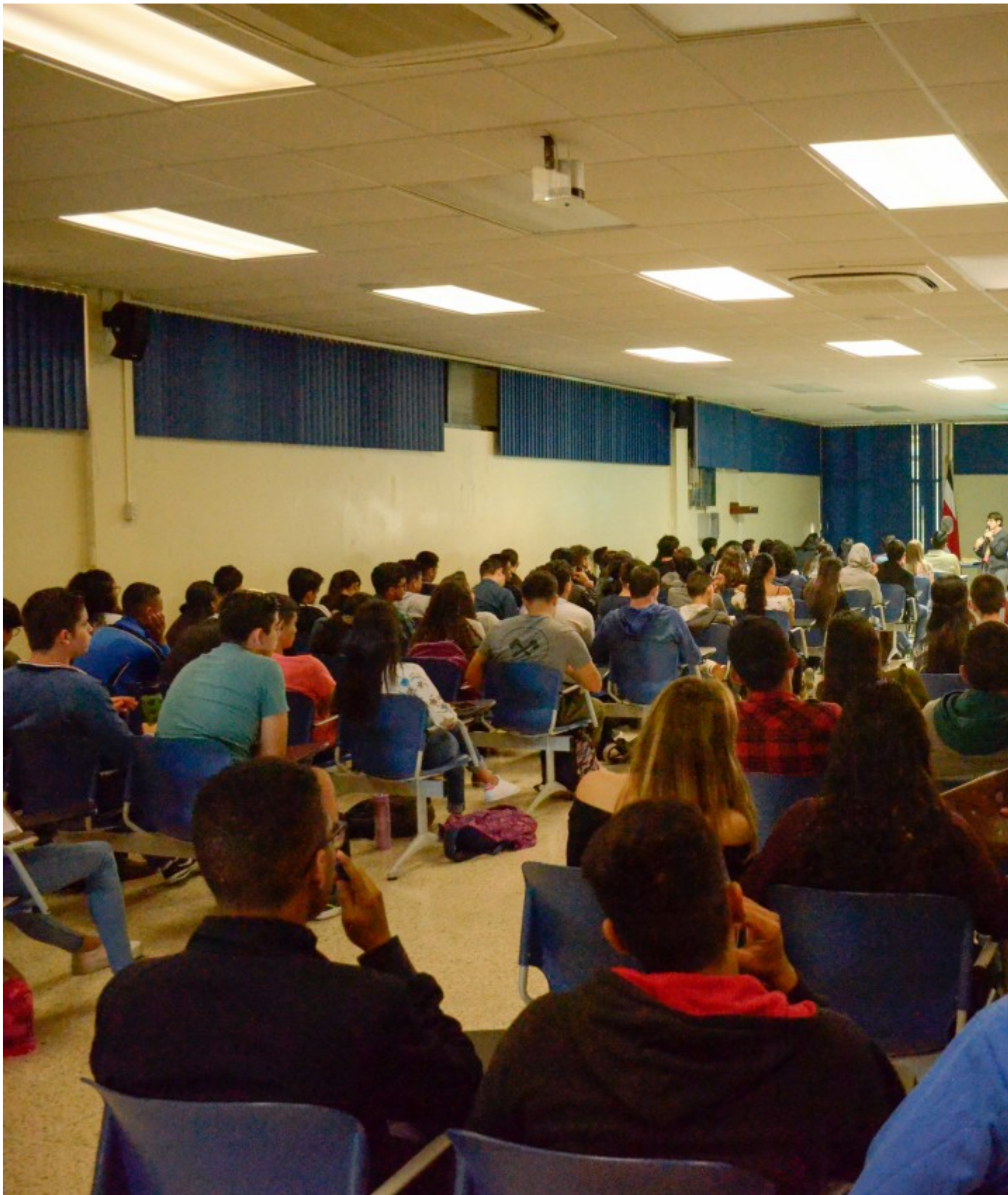
El Programa incluye una charla, donde se les explican los beneficios de ser