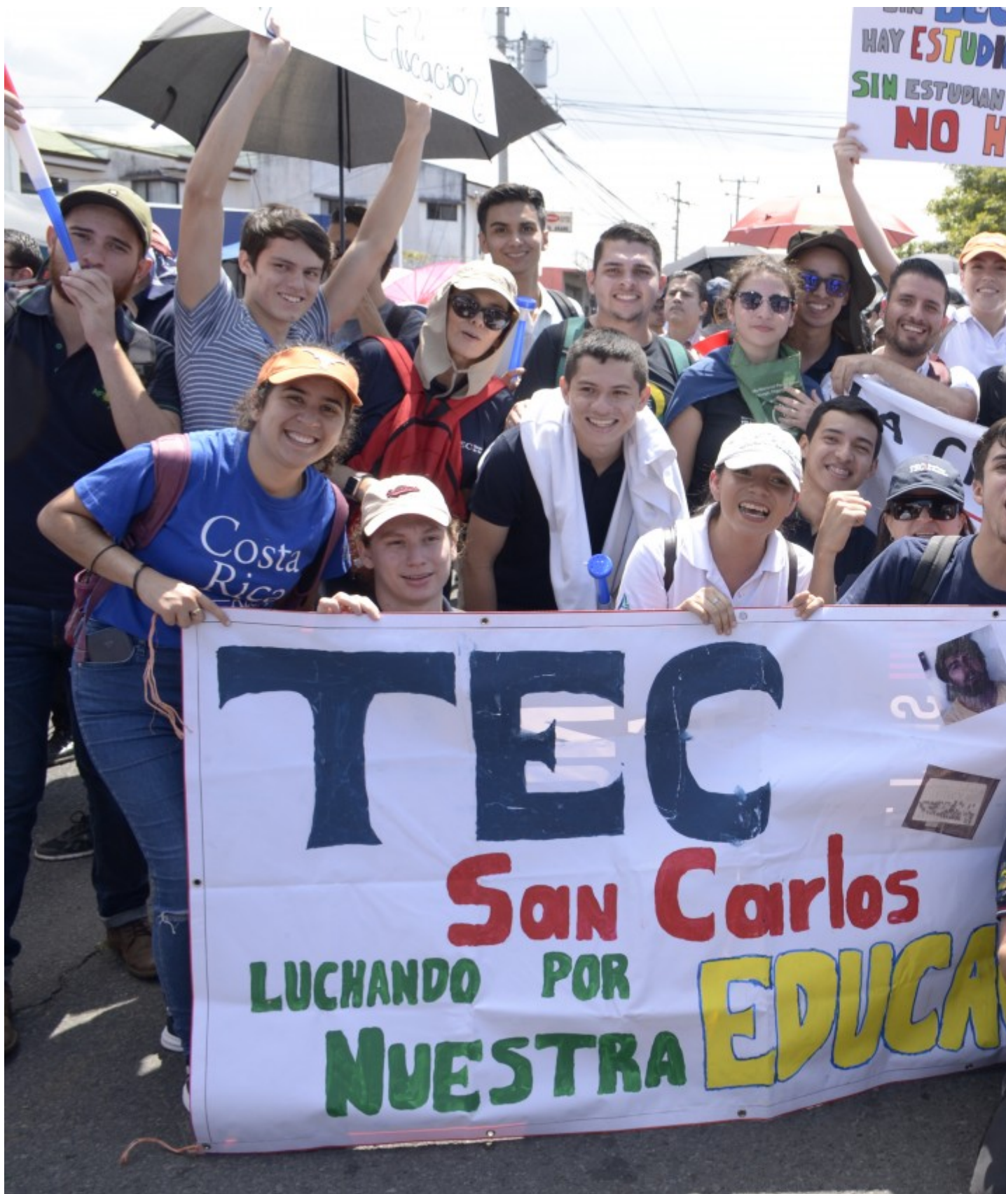
Sector docente y estudiantil del Campus del TEC en San Carlos, mostraron su