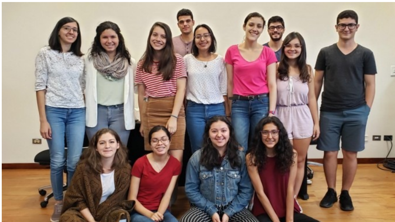
Miembros del Capítulo Estudiantil adscrito a la Sociedad Americana de Química (ACS, por sus siglas en inglés).