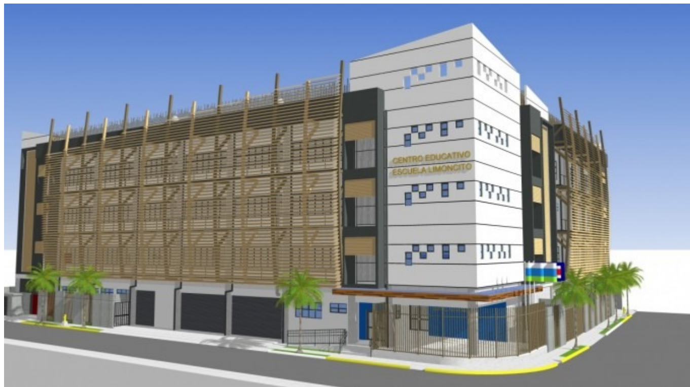
Fachada principal de la futura Escuela Limoncito.