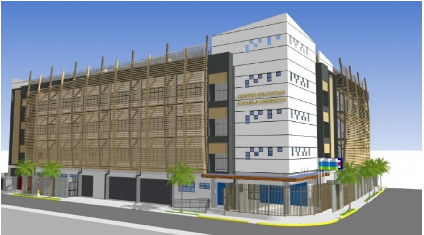
Fachada principal de la futura Escuela Limoncito.