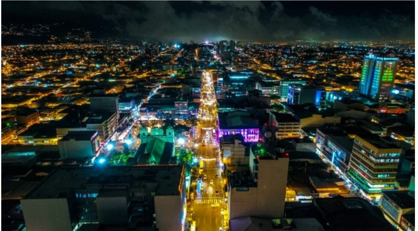
Imagen con fines ilustrativos.