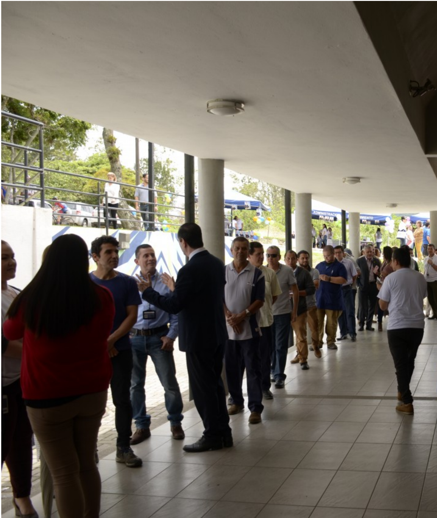
En el Campus Central, decenas de personas del sector administrativo hacen fila para