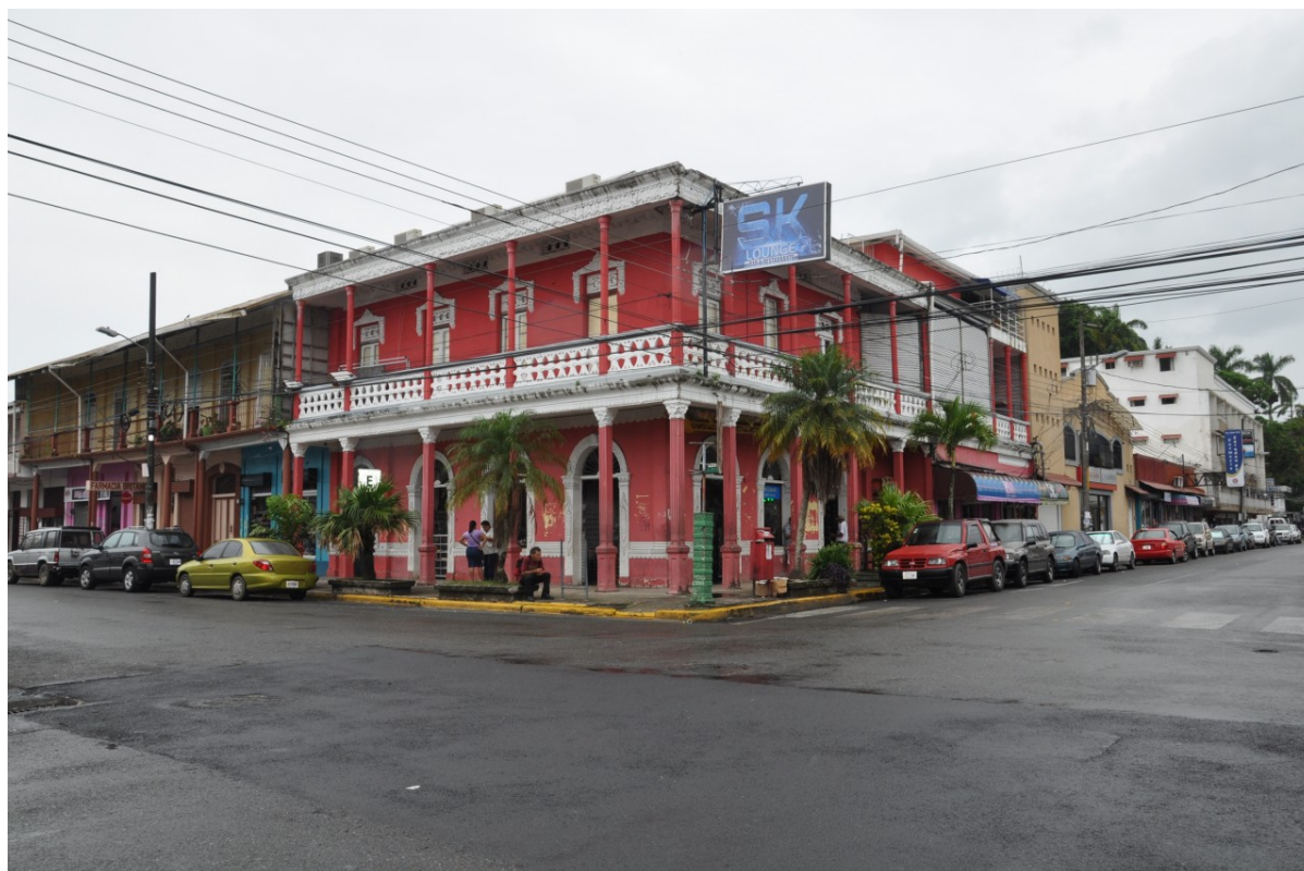
La academia, el Gobierno y la industria se comprometieron a trabajar conjuntamente para potenciar el desarrollo de la provincia de Limón.

Los mecanismos de implementación para la mejora de la competitividad sistémica de estos sectores son a través de “clústeres” y las “cadenas de valor”, usando como enfoque de atención la triple hélice (academia, instituciones y sector privado).