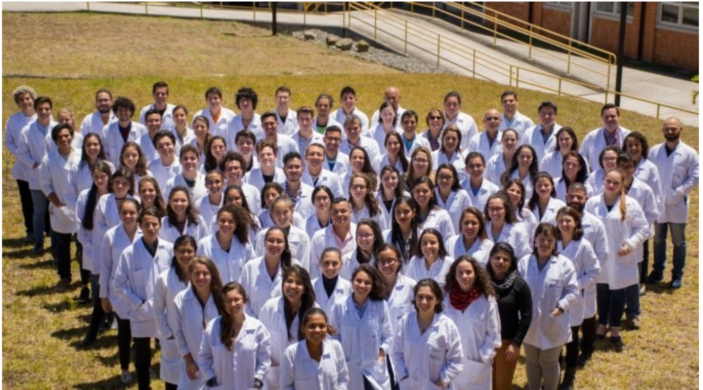
Equipo actual del CIB.

Informe de la OECD lo señala como uno de los actores de innovación en el país