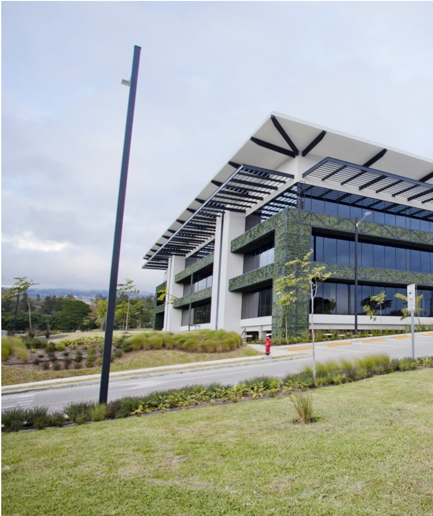
Primer edificio construido.