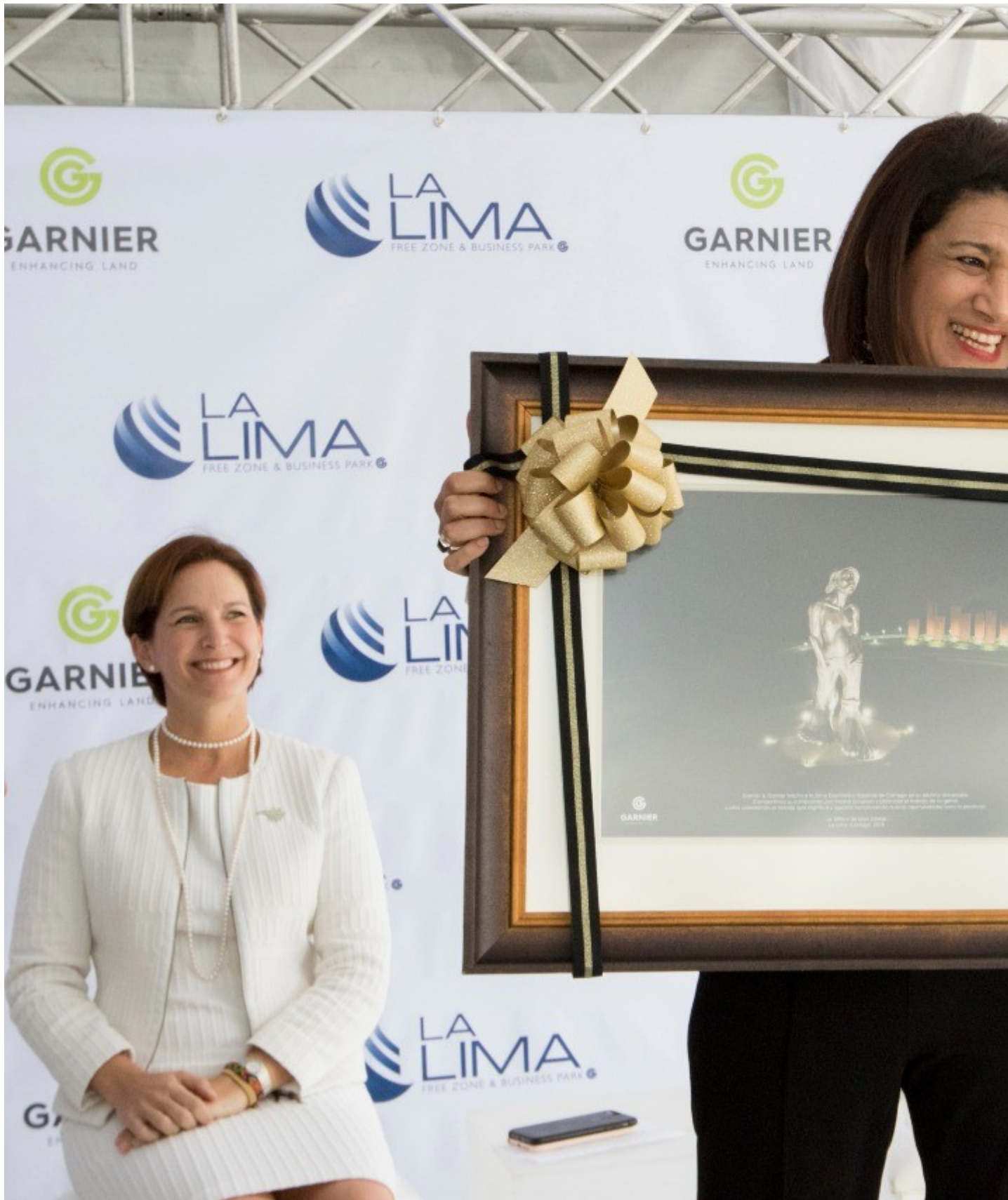
El reconocimiento es un cuadro con la escultura el Silvador.