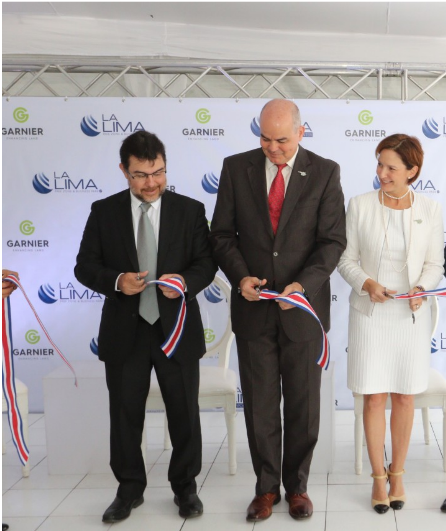
Acto oficial de inauguración.