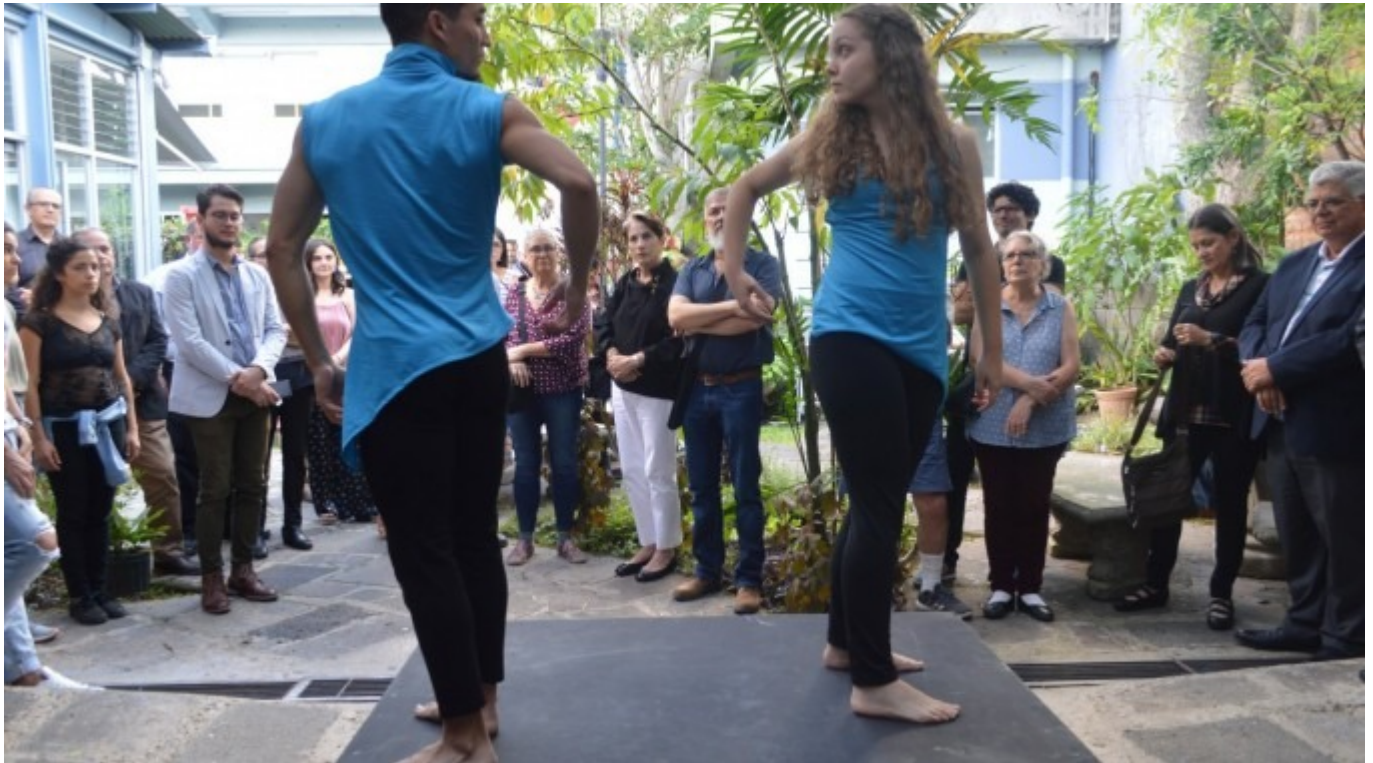
Los grupos DanzAmón, Andanza y DanzaTEC se presentarán en el cierre de la tarima principal en el marco del XII Festival Intersedes de Danza Contemporánea.