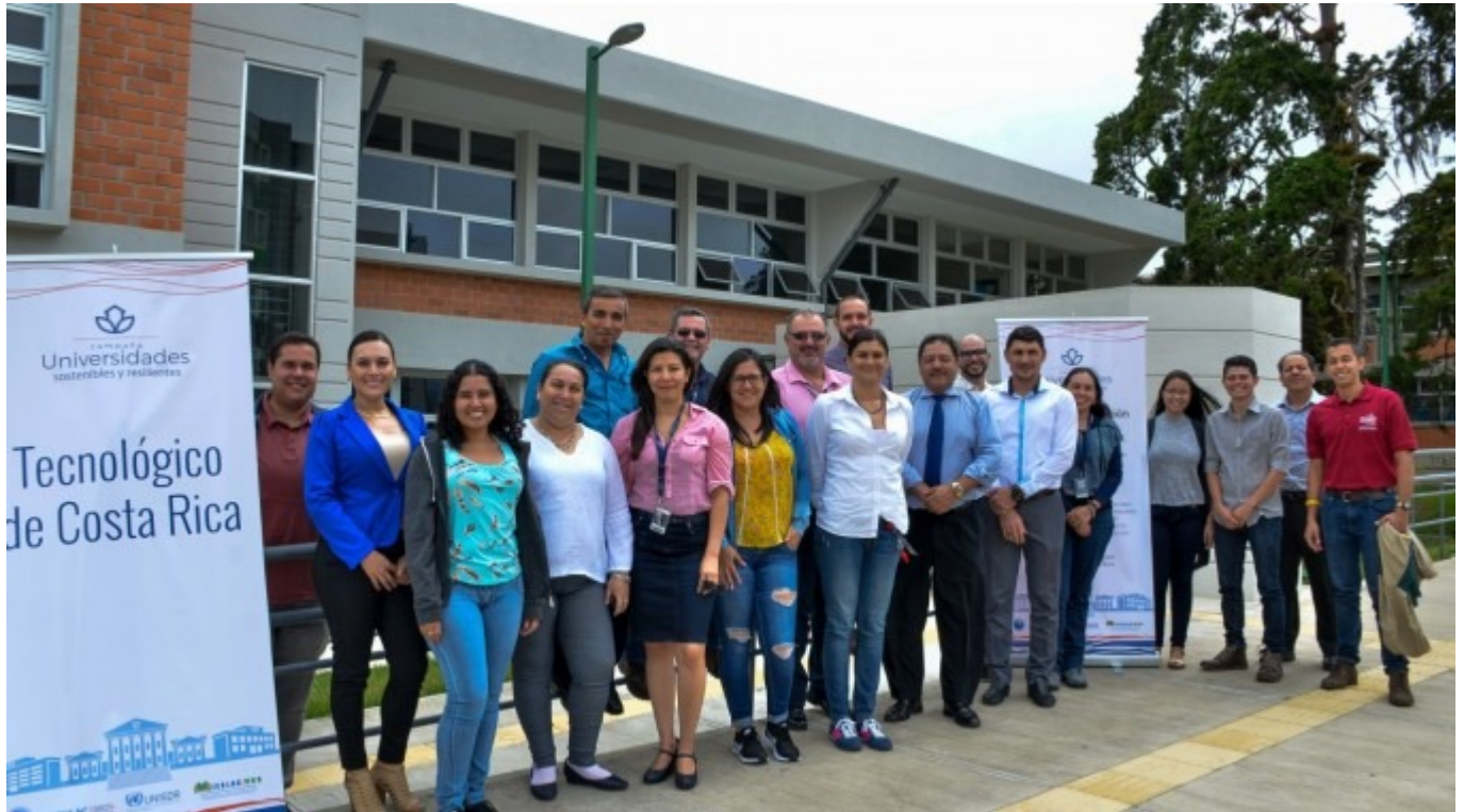
Integrantes del taller: "Promotores de la Campaña Universidad Sostenible y Resiliente".