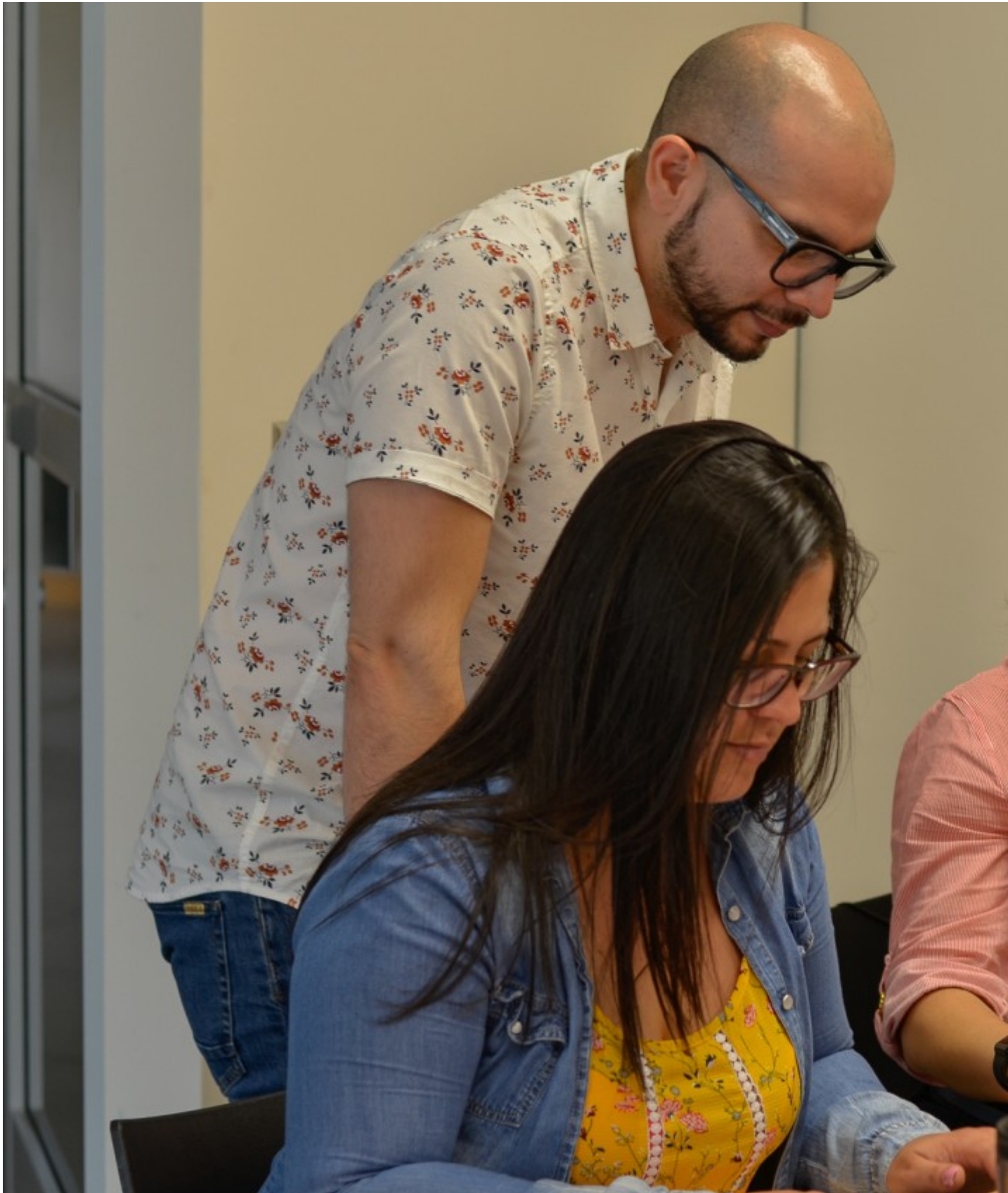
En el taller se indagó en comprender el riesgo, las propuestas estratégicas,