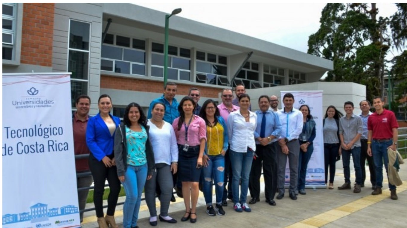
Integrantes del taller: "Promotores de la Campaña Universidad Sostenible y Resiliente".