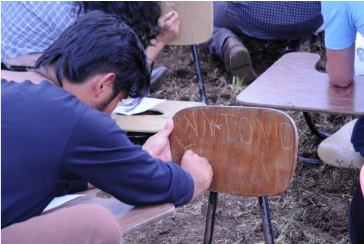
Los estudiantes de Artes Visuales del TEC rindieron homenaje escribiendo el nombre de cada uno de los desaparecidos en pupitres colocados en la tierra.

La desaparición de los 43 estudiantes se dio el 26 de setiembre de 2014 en la comunidad de Ayotzinapa en el estado de Guerrero en México y hasta la fecha la investigación sigue abierta sin conclusiones certeras.