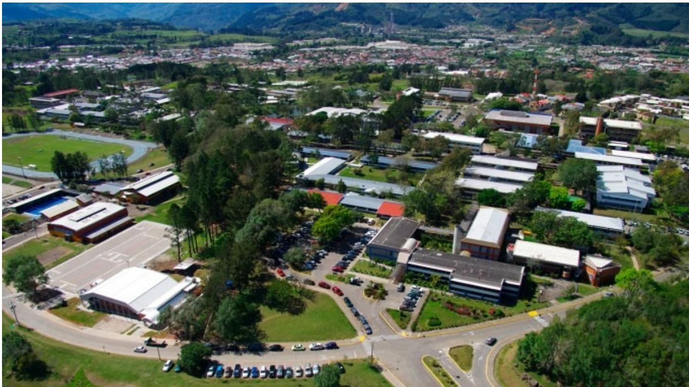
Vista aérea del Campus Central.