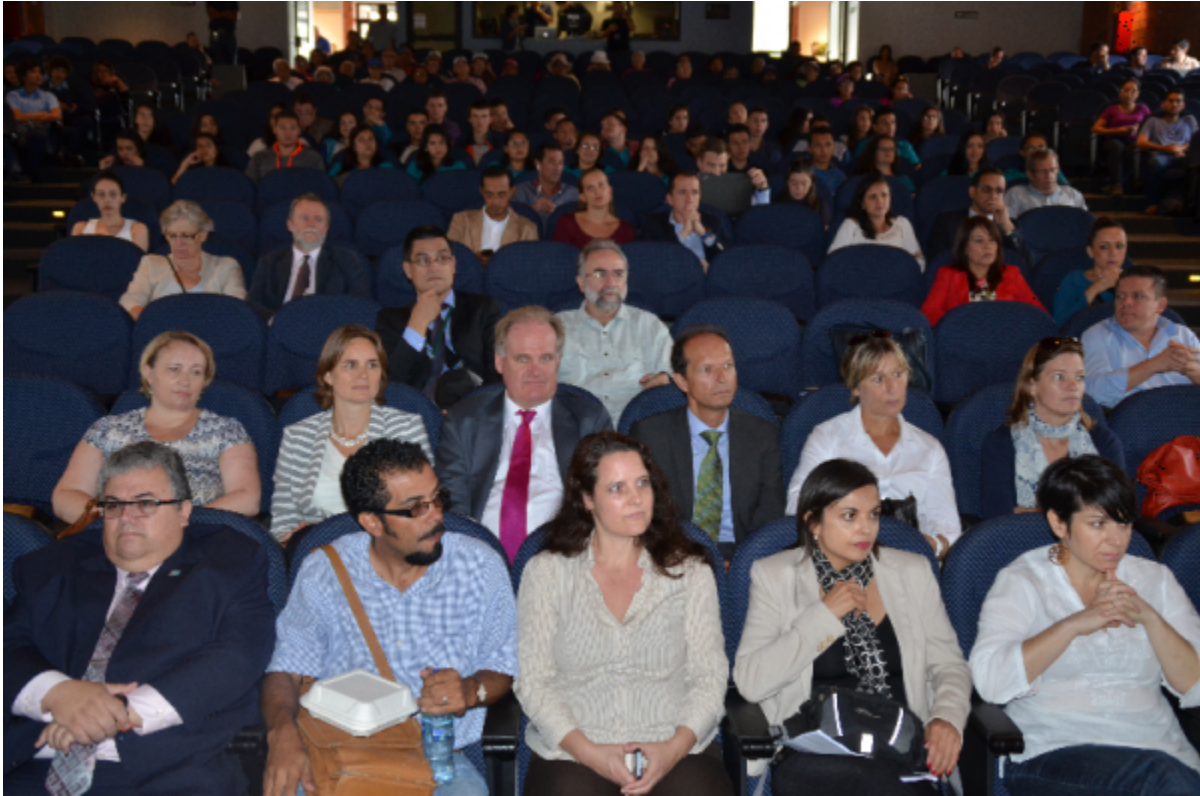
Expertos y asistentes en la mesa redonda "Ciudadanía, Gobiernos Locales y Movilización Urbana".

Source URL (modified on 04/10/2018 - 08:57): https://www.tec.ac.cr/hoyeneltec/node/283