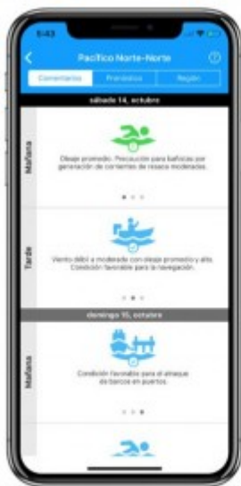
App MIO CIMAR 2015-2018