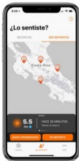
App RSN Mayo 2018