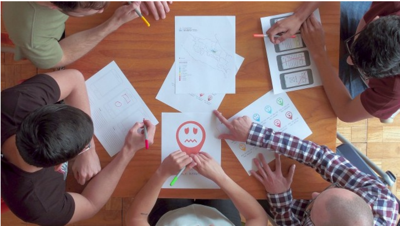
Sesión de trabajo de Equipo Imactus, en Casa Trópica.

“Gran parte de nuestros proyectos se han desarrollado con múltiples sesiones de trabajo en las instalaciones de Casa Trópica. Hemos participado en actividades en conjunto con otros emprendimientos de TEC Emprende Lab y algo muy importante, es que hemos aportado a los otros emprendimientos al dar capacitaciones a los estudiantes en temas como el desarrollo de recursos visuales. Además, ofrecemos una colaboración para " Las 24 horas de innovación" con talleres gratuitos a los estudiantes ganadores de este certamen interinstitucional”, puntualizaron los emprendedores.