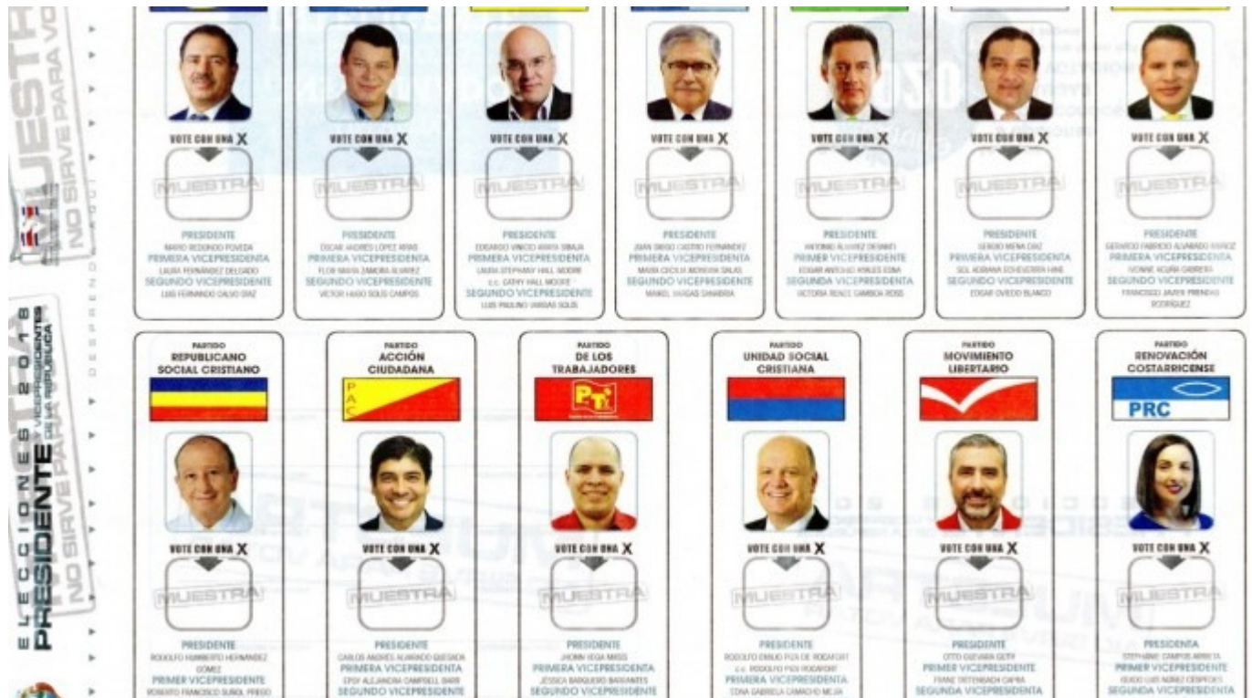
Muestra de la boleta de votación de los candidtos presidenciales. (Imagen cortesía del Tribunal Supremo de Elecciones).