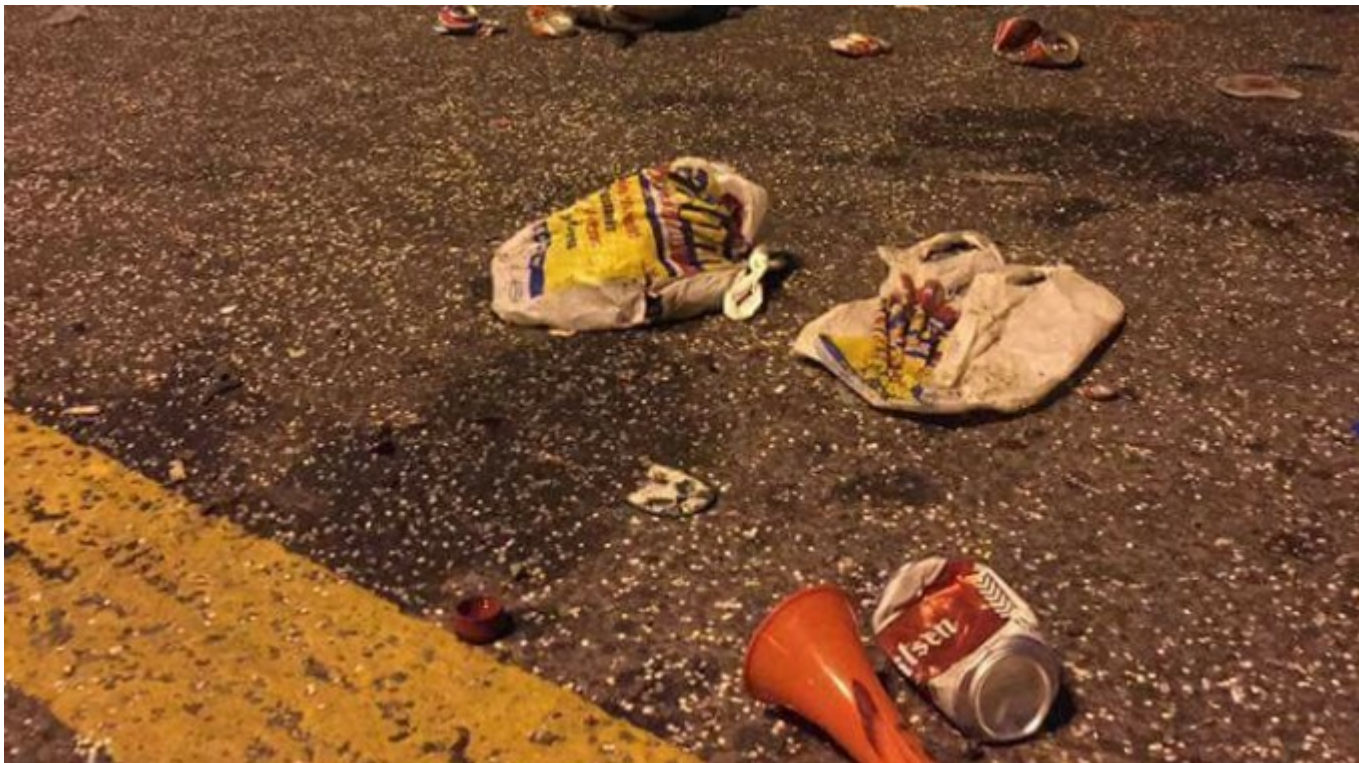
Fotografía tomado del sitio: https://goo.gl/zP1Gkj [1]