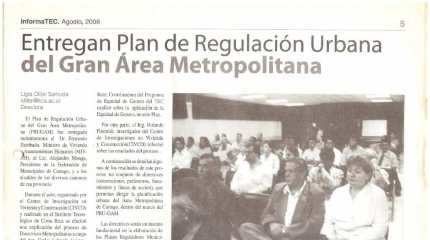
InformaTEC Nº 255, agosto del 2006. Entregan Plan de Regulación Urbana del Gran Área Metropolitana.