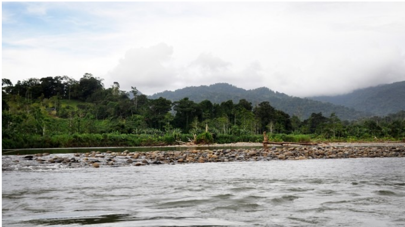
Paísaje del río Telire, en Talamanca.