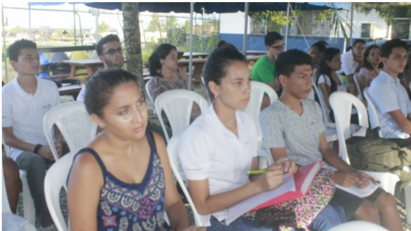
Estudiantes del Centro Académico de Limón participan de los foros organizados por los profesores de la Escuela de Ciencias del Lenguaje