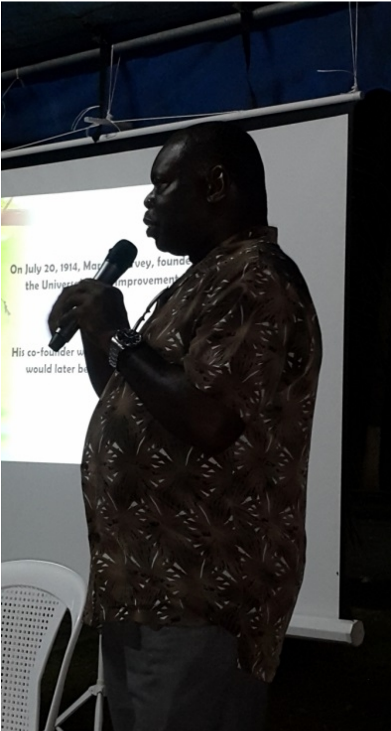
Winston Norman, presidente de Universal Negro Improvement Association (UNIA).